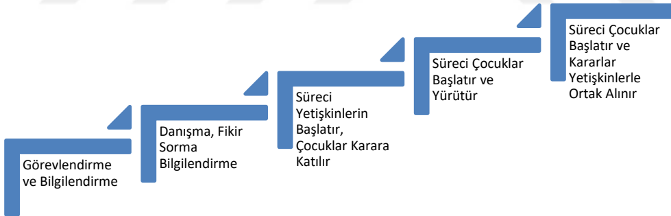
Şekil 2: Katılım Merdiveni (Katılımın Aşamalandırıldığı Basamaklar)(Roger Hart’ın 1992 yılında UNICEF tarafından yayınlanan “Children’s Participation From Tokenism To Citizenship” kaynağına dayanılarak oluşturulmuştur).

Katılım merdiveni, çocuk katılımının alt düzeyden üst düzeye doğru arttırılarak aşamalandırıldığı bir yapı izlemekte, bu anlamda iki ayrı bölüme ayırdığımız basamaklandırmanın 4. aşamasından itibaren çocukların sürece katılımı giderek güçlenmektedir.