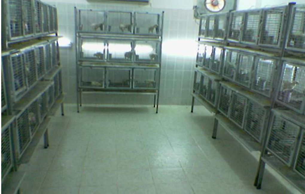
Resim 3.2. Deneme Ünitesinin Genel Görünümü

Deneme süresince deneme odasının sıcaklık ve nispi nem düzeyi oda içerisinde bulunan klima ve radyatörler ile ayarlanmıştır. Sıcaklık ve nispi nem ilk haftalarda 2 adet radyatör ve tam kontrollü klima ile, daha sonraki haftalarda ise ünite de bulunan tam kontrollü klima düzeni ile ayarlanmıştır. Deneme süresince deneme odasının sıcaklığı 33 °C'den itibaren haftada 3 °C düşürülerek denemenin 4. haftasından itibaren 22-24 °C de sabit tutulmuştur. Nispi nem ise deneme süresince %50-60 düzeylerinde tutulmuştur. Deneme süresince, deneme odasında 24 saat aydınlatma uygulanmıştır. Deneme odası, fanlar aracılığı ile havalandırılmıştır.