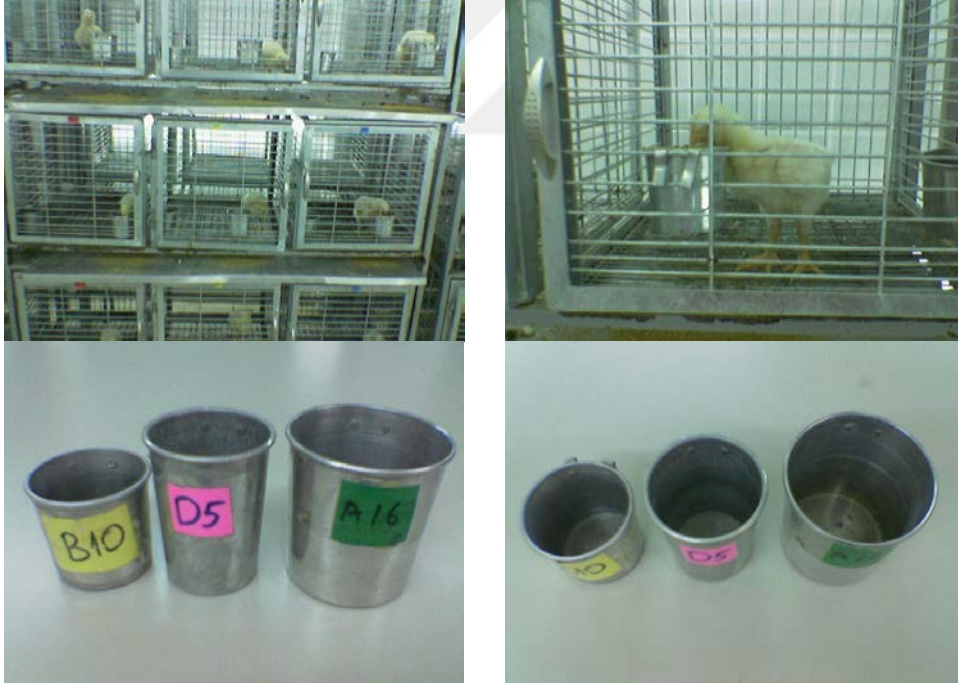
Resim 3.3. Denemede Kullanılan Kafes, Yemlik ve Suluklar

Deneme odasında, 3'er katlı, her katta 3 bireysel kafes gözü bulunan 9 bloklu kafesler, duvardan uzaklığı 0.4 m olacak şekilde yerleştirilmiştir. Kafeslerin her biri 40x40x40 cm ebatlarındadır. Kafesler galvanize sacdan yapılmış olup her bir katın yem saçımını önleyen ve dışkılarının döküldüğü alüminyumdan yapılmış, yem toplama ve dışkı toplanması sırasında çıkarılıp takılabilen altlıklar bulunmaktadır. Deneme süresince civcivlerin yaş dönemlerine ve vücut büyüklüklerine göre değişen boyutlarda yemlikler ve suluklar kullanılmıştır. İlk 2 hafta küçük boy yemlik ve suluklar (7 cm çapında, 7 cm yüksekliğinde), 3 ve 4. haftalar arası orta boy yemlik ve suluklar (7 cm çapında ve 10 cm yüksekliğinde), 5 ve 6. haftalar arasında ise büyük boy yemlik ve suluklar (9 cm çapında ve 10 cm yüksekliğinde) kullanılmıştır (Resim 3.3).