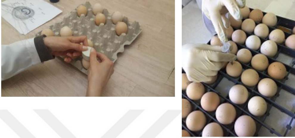
Resim 3.1. In Ovo Enjeksiyon İşlemi