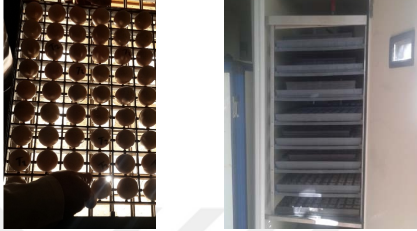
Resim 3.4. Döllülük Kontrolü ve Kuluçka Makinası

Kuluçkanın 16. gününde in ovo enjeksiyon yapılan yumurtalardan çıkan canlı ağırlıkları benzer erkek etlik civcivler besiyeye alınmışlardır. Denemede 80 hayvan, başlangıç canlı ağırlıkları benzer (43.8 g) ve her birinde 20 civcivin bulunduğu 4 gruba ayrılmıştır. Hayvanlar 1-10. günler arasında başlatma, 11-21. günler arası büyütme, 22-35. günler arası bitirme yemleri almıştır. Denemede oluşturulan muamele grupları Çizelge 3.3’de verilmiştir.