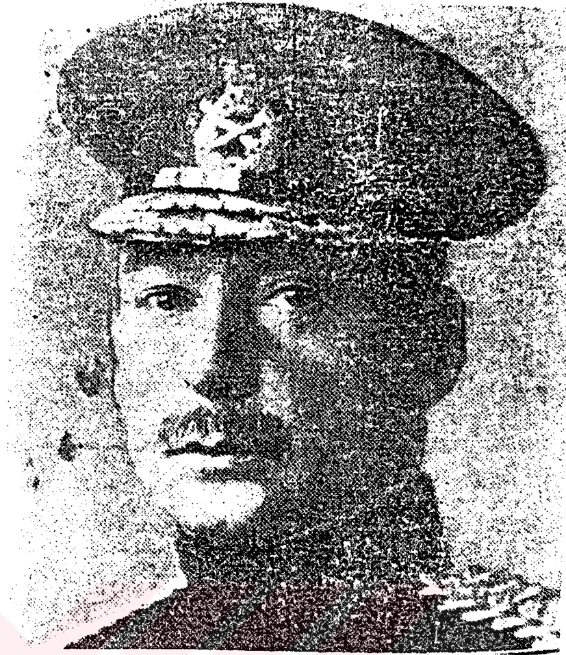
İngiliz Generali Townshend