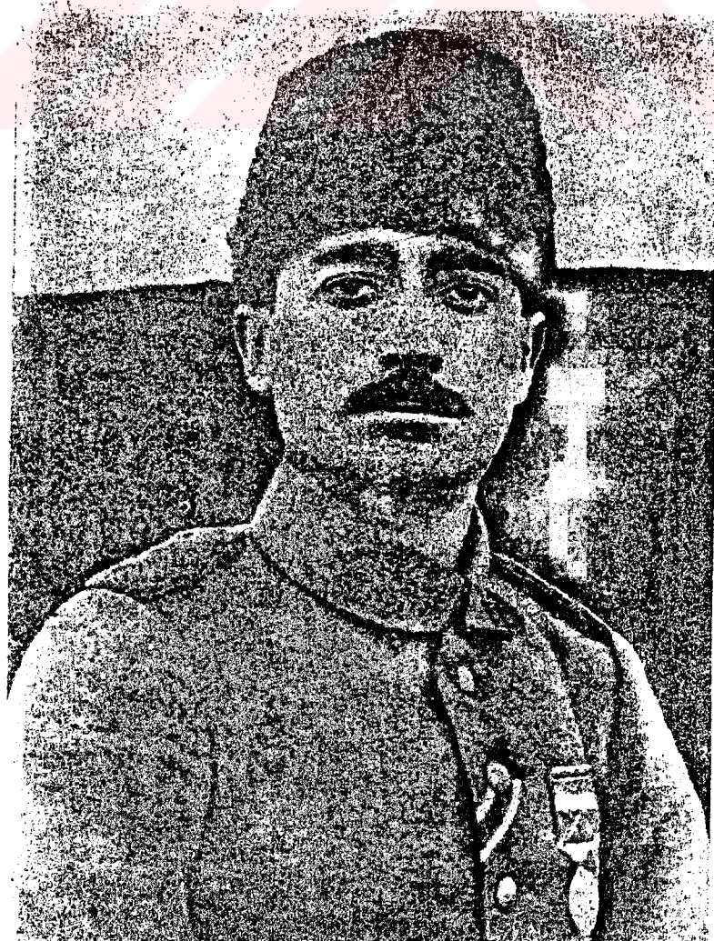
HALİL PAŞA (KUT) ORGENERAL