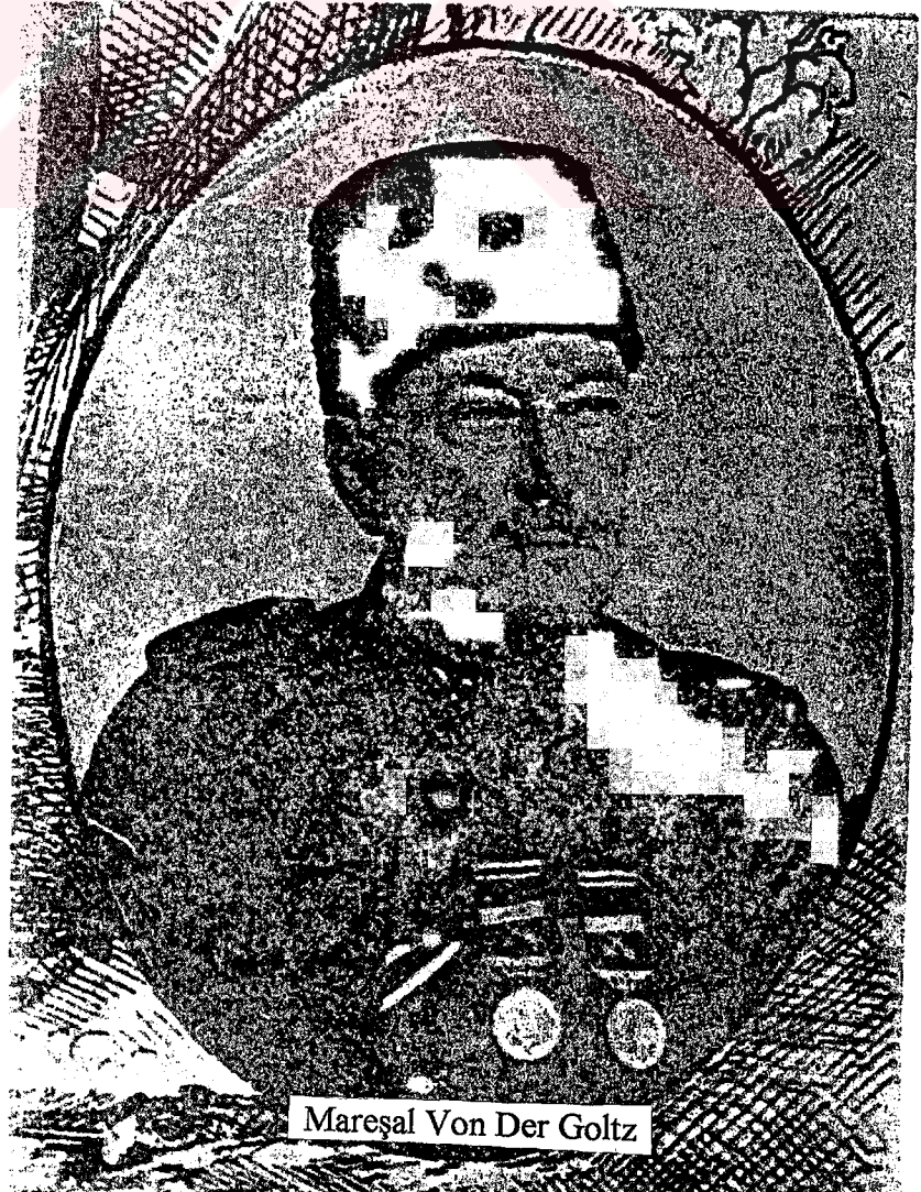
Mareşal Von Der Goltz