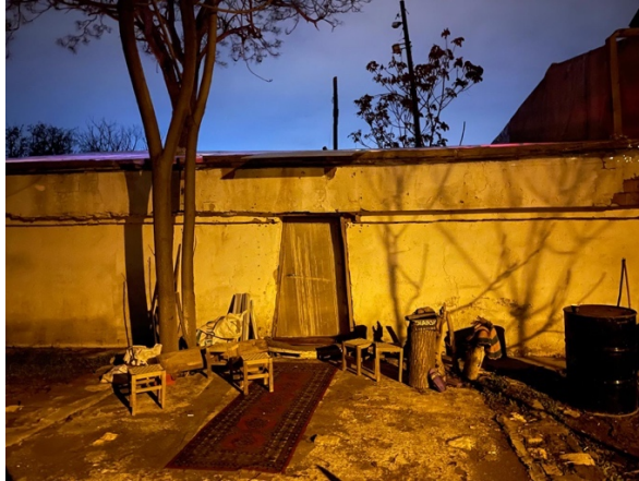
Şekil 4a. Hiçhane'nin arka bahçesindeki oturma alanı (12.12.2023)