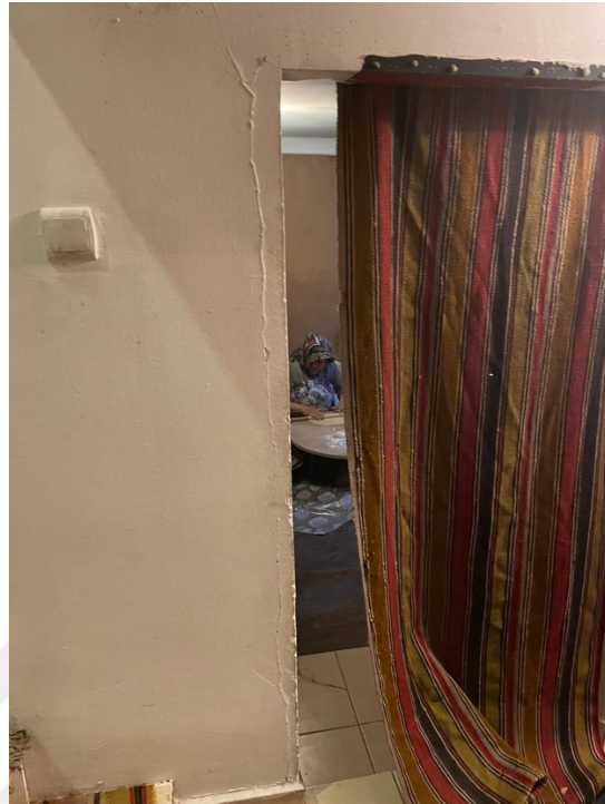
Şekil 3. Hiçhane’de etkinlik sırasında hazırlanan saç böreği (13.12.2023)

Geniş alana geçişte yer alan ritmik mumlar, loş ışıklar, yerdeki halılar ve ortada konumlanan DJ seti ile alan, sürekli bir ritüel düzenini barındırır. Mekânın tavanı camla kaplıdır; gece etkinliklerinde ışıkların camdan yükseldiği atmosfer, adeta bir 'dünya dışı alan' hissi yaratır. Alanın sağ tarafında DJ setinin yer aldığı masada bir semazen sarığı, dijital ekipmanlar, yerel çalgılar ve mumlar bir aradadır; bu kurgu, dijital ve manevi olanın fiziksel olarak bir arada sunulduğu bir "ritüel masası" izlenimi yaratır. Asma katta bulunan yatak, bazı katılımcıların geceyi orada geçirmesine imkân tanırken, geniş bahçede çadır kuran yabancı katılımcılar, Hiçhane'nin geçici bir toplulukta konaklama, deneyimleme ve var olma alanı olarak işlev gördüğünü gösterir.