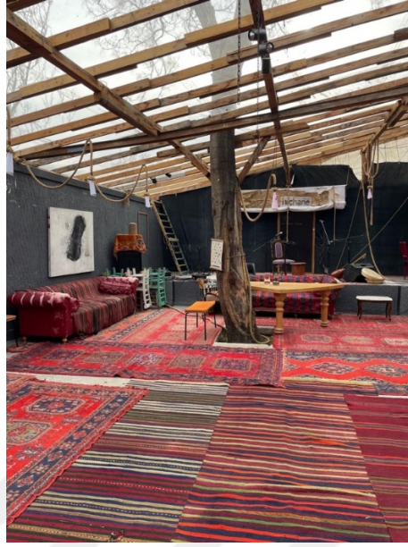
Şekil 7a. Hiçhane iç mekan gündüz görünümü (14.12.2023)