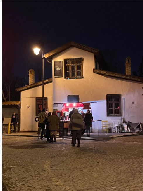
Şekil 1. Hiçhane'nin dış cephe görünümü (12.12.2023)

Konya'da Mevlana Türbesi'ne yürüme mesafesinde, dışarıdan bakıldığında sade bir taş ev görünümünde olan Hiçhane, yalnızca fiziksel bir yapı olmaktan öte; farklı inanç sistemleri, estetik anlayışlar ve beden pratiklerinin iç içe geçtiği çok katmanlı bir ritüel alanıdır. Mekânın sembolü olan kırmızı semazen figürü, sadece bir logo değil; Hiçhane'nin mekânsal ve politik estetiğini simgeleyen bir motif olarak çeşitli nesnelere (bileklik, duvar, poster vb.) işlenmiştir.