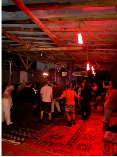
Şekil 6. Hiçhane’de gerçekleştirilen ekstatik dans performansından bir kare (12.12.2023)