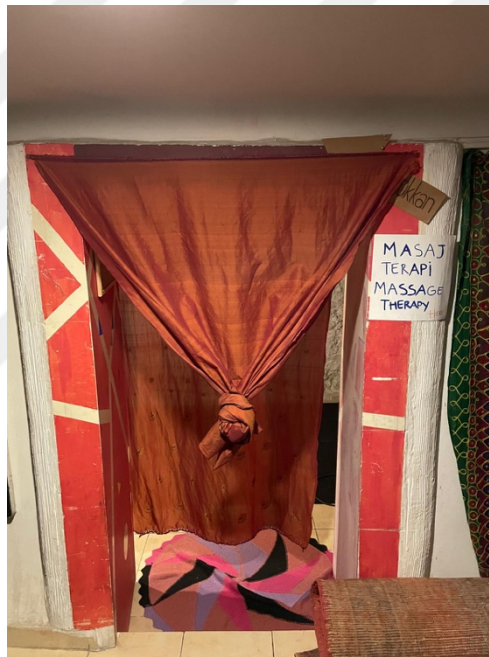
Şekil 2. Hiçhane'de bulunan masaj odasının girişi (12.12.2023)