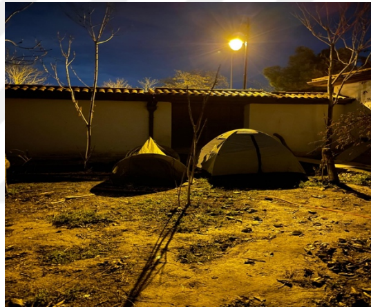
Şekil 4b. Aynı bahçede katılımcıların kaldığı çadırlar (12.12.2023)

Mekânın köpeği Marry, yalnızca evcil bir hayvan değil, ritüelin parçası gibidir. Neredeyse her etkinlikte içeride özgürce dolaşır; katılımcılarla kurduğu temas, Hiçhane'nin kapsayıcı ve hiyerarşisiz yapısının bir başka tezahürüdür.