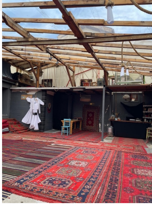
Şekil 7b. Hiçhane gündüz görünümü (14.12.2023)