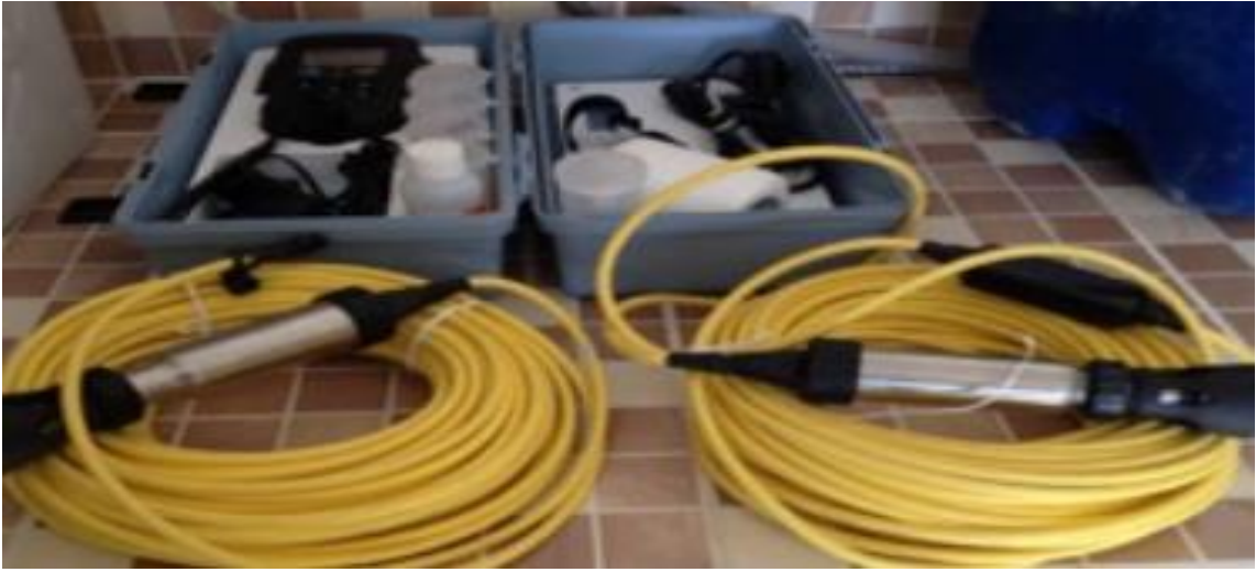
Şekil 3.2 Arazi tipi multimetre cihazı HACH HQ 40D

Bulanıklık ölçümleri HACH 2100Q marka portatif Türbidimetre cihazı kullanılarak yapılmıştır (Şekil 3.3). Ölçüm işlemleri sırasında, Türbidimetre cihazının numune kabı saf su ile özenle çalkalanmış, böylece ölçümlerin doğruluğunu etkileyebilecek olası kirleticiler giderilmiştir. Tüm analiz süreci boyunca kontaminasyonu önlemek ve hijyenik koşulları sağlamak amacıyla lateks eldiven kullanılmıştır. Elde edilen ölçüm sonuçları, uluslararası standartlara uygun olarak NTU (Nephelometrik Bulanıklık Birimi) cinsinden ifade edilmiştir.