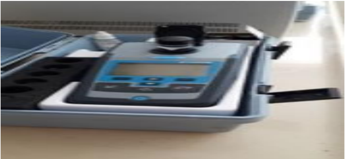
Şekil 3.3 HACH 2100Q marka turbidimetre cihazı