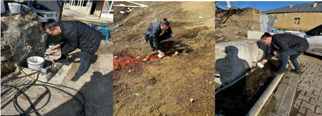
Şekil 4.2 Çeşitli örnekleme noktalarından su numunelerinin alınması