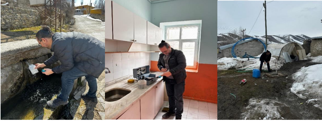
Şekil 4.1 Çeşitli örnekleme noktalarından su numunelerinin alınması

2024 yılı Mart ayında, İpekyolu ilçesindeki 22 mahallede gerçekleştirilen su numunesi alım çalışmalarında, (Şekil 4.1 ve Şekil 4.2) su kaynaklarının bölgedeki yerleşik halkın ihtiyaçlarını karşılayacak yeterlilikte olmadığı gözlemlenmiştir. Çeşitli mahallelerde, suyun yalnızca günde bir saat süreyle sağlandığı tespit edilmiştir. Bu durum özellikle suya erişimin kısıtlı olduğu mahallelerde, halkın günlük yaşamını olumsuz yönde etkilemektedir. Bunun yanı sıra, bazı mahallelerdeki su kaynaklarının yerleşim alanlarından uzak, yol kenarlarına ve hayvan barınaklarına yakın konumlandığı gözlemlenmiştir. Bu tür konumlar, suyun kirlenme riskini artırmakta ve su kalitesinin olumsuz etkilenmesine yol açabilmektedir.