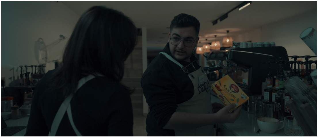
Görsel 19: Sahne3 Salih Orta plan