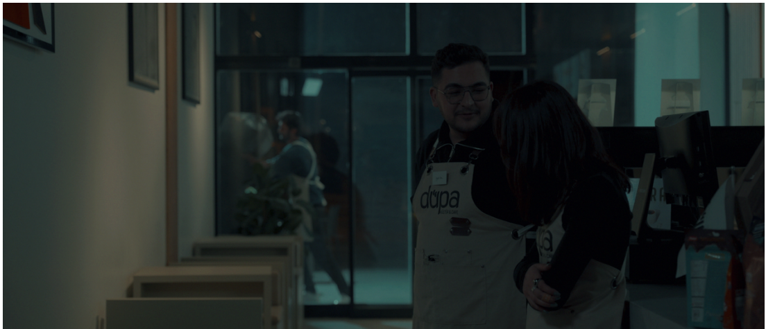
Görsel 29: İkili arkaplanda aksiyon