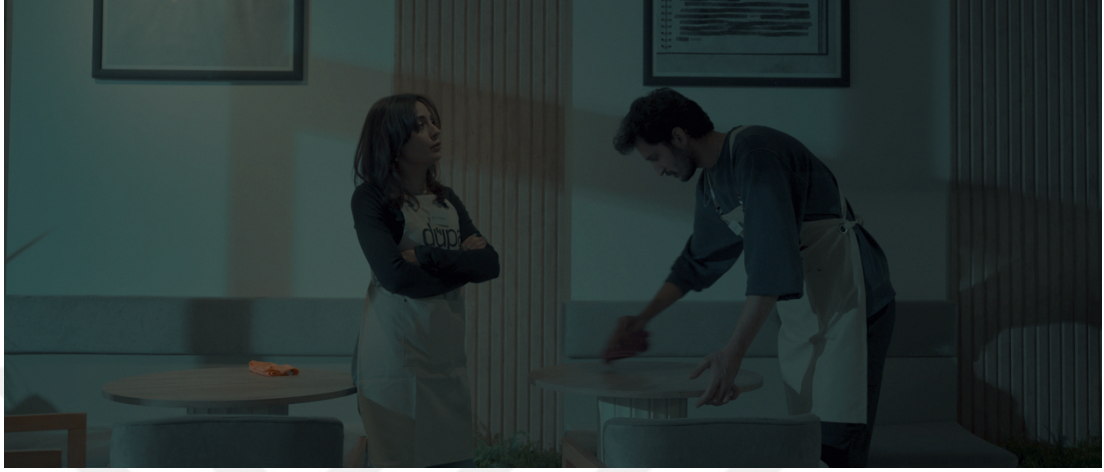
Görsel 14 sahne5 yakın ikili plan

izleyicinin karakterler arası gerilimi yorumlamasına imkân tanırken, aynı zamanda bu gerilimi mekânsal düzenlemeyle pekiştirir.