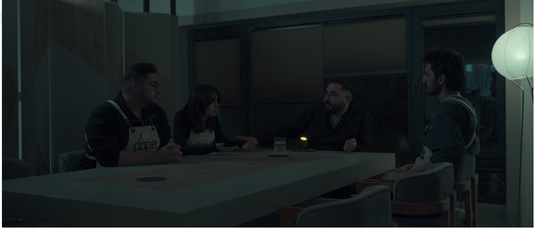
Görsel 12: Sahne 9 toplu masa planı

Film boyunca kompozisyonun nasıl kullanıldığına bakıldığında, karakterlerin mekân içindeki konumlandırılma biçimi, onların sosyal ve psikolojik durumlarını izleyiciye aktarmanın önemli bir yolu olarak işlev görmektedir. Özellikle Baran'ın çerçevede sürekli olarak arka planda veya kenarda konumlandırılması, onun anlatı içinde yalnız ve güçsüz bir karakter olduğunu vurgulayan bilinçli bir tercihtir. Baran'ın müdürle olan yüzleşme sahnesinde, ilk defa çerçevenin merkezine yaklaşması ve mekân içinde fiziksel olarak daha belirgin bir pozisyonda gösterilmesi, karakterin içsel patlamasının ve psikolojik olarak dönüşüm geçirdiğinin bir göstergesidir. Bu değişim, çerçevede yapılan kompozisyon tercihlerinin yalnızca estetik değil, aynı zamanda anlatısal bir işlevi olduğunu göstermektedir.