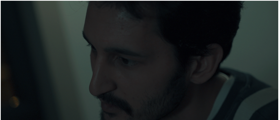
Görsel 24: Baranda tedirginlik hissi