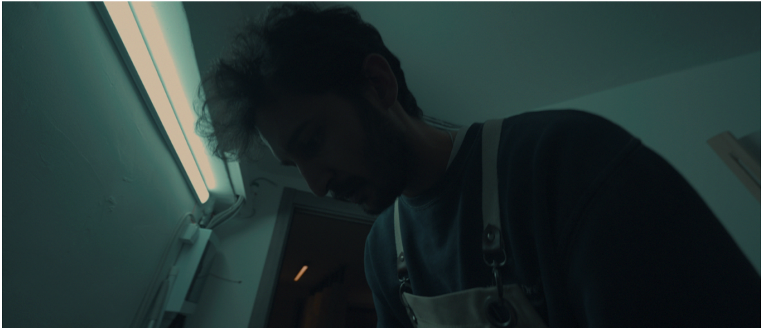
Görsel 21: Sahne 10 Baran alt aç

Filmin ilk bölümlerindeki daha durağan ve simetrik kamera yerleşimleri, anlatının ilerleyişiyle birlikte yerini daha asimetric, kaygı uyandırıcı ve dinamik kadrjlara bırakmaktadır. Bu dönüşüm, Baran karakterinin zaman içinde yaşadığı psikolojik aşınmayı temsil eden önemli bir yapıtaş olarak değerlendirilir. Özellikle karakterin yalnız kaldığı sahnelerde kameranın onu tek başına ve çerçevenin kenarında bırakacak biçimde konumlandırılması, bu yalnızlaşma sürecini kuvvetlendiren sinematografik bir tercihtir.