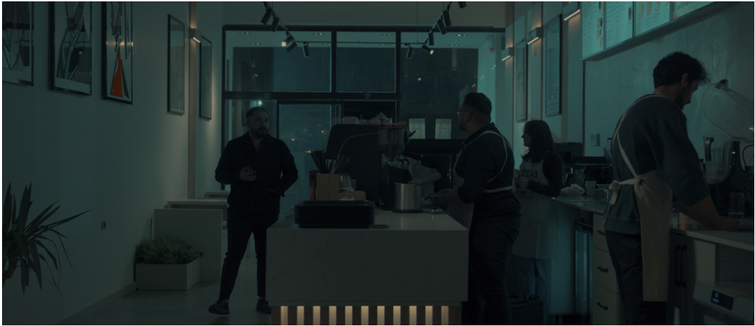
Görsel 11: Sahne3 kafe genel

Baran ve Neslihan'ın birlikte çalıştıkları bu sahne, her iki karakterin de anlatı boyunca kendi iç dünyalarına kapanma hâlini sürdürdüklerini çerçeve düzeyinde açıkça sunmaktadır. Mekânla kurulan ilişkileri, fiziksel hareket alanlarının kısıtlı oluşu ve birbirlerine temas edememeleri, karakterlerin yalnızlık ve güvensizlik temalarına hizmet edecek biçimde konumlandırılmıştır. Çerçeveleme tercihi, izleyiciye karakterlerin duygusal ve düşünsel pozisyonlarını doğrudan aktarmamakta, aksine görsel olarak sezdirme amacı taşımaktadır. Kompozisyonun bu biçimde yapılandırılması, filmin genel sinematografik yaklaşımına da uygun bir görsel strateji sunar. Blain Brown'a göre, "kompozisyon yalnızca görüntüyü düzenlemek değil, izleyiciye anlatının nasıl algılanması gerektiğine dair görsel ipuçları sunmaktır" (Brown, 2006) Bu bağlamda filmde kullanılan çerçeveleme biçimi, karakterler arası mesafe ve mekânla kurdukları ilişki göz önüne alındığında, anlatının psikolojik yönünü pekiştiren etkili bir sinematografik tercihe dönüşmektedir.