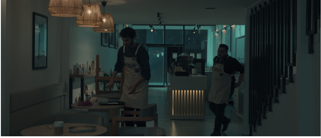
Görsel 1: sahne 01 Kafe genel

Filmin genelinde kullanılan ışık ve renk paleti, mekânın duygusal olarak mesafeli ve nötr bir ortam olduğunu hissettiren bir görsellik yaratmaktadır. Soğuk tonların ağırlıkta olması, karakterlerin içsel dünyalarındaki mesafeyi ve birbirlerine olan güvensizliği vurgulamak için bilinçli bir tercih olarak öne çıkmaktadır.