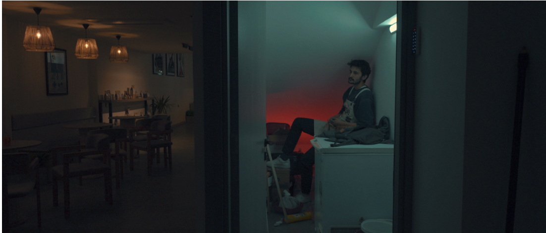
Görsel 2: Sahne 7 Baran Genel

İstemek, Olmak ve Öncesi adlı kısa filmde, karakterlerin iç dünyasını yansıtmak amacıyla düşük anahtar ışık (low-key lighting), gölgelerin yoğun olduğu sahne kurguları ve sınırlı bir renk skalası tercih edilmiştir. Özellikle Baran karakteri üzerinden ilerleyen anlatıda, soğuk tonlar ile sarı ışığın eş zamanlı kullanımı karakterin psikolojik gerilimini ve yalnızlık hissini pekiştiren görsel bir atmosfer yaratmaktadır. Aşağıda yer alan sahne görselinde, Baran karakteri kafenin arka planında yer alan dar bir odada, düşük tavanlı, sınırlı ışık alan bir mekânda, ışığın yalnızca tepe noktasından vurduğu bir kompozisyonda sunulmuştur.