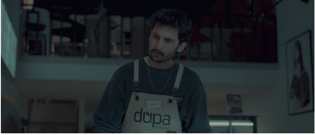
Görsel 16: sahne5 Baran alt açılı