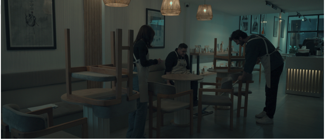
Görsel 26: Üçlü Geniş Plan