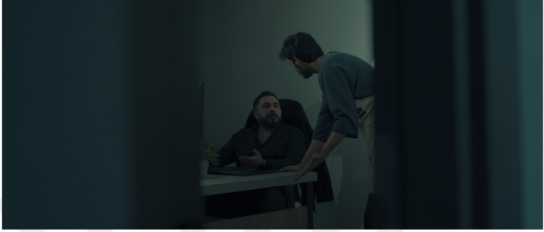
Görsel 32: İki kişilik plan

uzak yapısı korunmakta; bu da karakterin psikolojik çözülüş sürecinin nihai bir sona değil, devam eden bir bozulma sürecine işaret ettiğini göstermektedir.