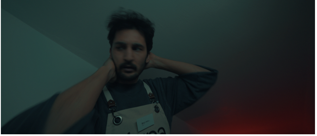
Görsel 22: Baran orta Plan