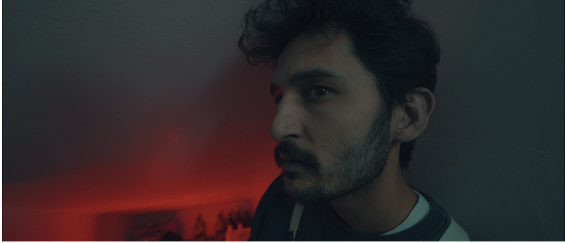
Görsel 28: Baran yakın geniş plan

Kamera açıları aracılığıyla karakterler arasında hiyerarşik farklar da çerçeveye yansıtılmaktadır. Örneğin, Salih karakterinin Neslihan ile olan sahnelerinde, Salih sıklıkla daha aşağı seviyede ve çerçevenin alt kısmında konumlandırılırken; Neslihan dik, sabit ve üst düzeyde gösterilmektedir. Bu farklılık, kamera yerleşimi üzerinden karakterlerin sahne içi güç ilişkilerini yapılandıran bir unsur hâline dönüşmektedir. Film boyunca kamera açıları, yalnızca karakterleri görüntüleme aracı olmaktan çıkarak, onların iç dünyalarını açığa çıkaran bir anlatı mekanizması olarak işlemiştir. Her plan, karakterlerin ruhsal çözülme süreçlerine dair ipuçları taşımakta; çerçeve içi boşluklar, kadraj darlığı ya da karakterin konumlandırılması gibi unsurlar, izleyiciyi karakterin zihinsel dünyasına dâhil eden araçlar olarak kullanılmaktadır.