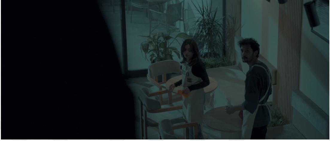
Görsel 10: Sahne gözlemci plan

Özellikle çerçeve içindeki karakter yerleşimi ve mekânsal sınırların kullanımı, karakterlerin anlatı içindeki rollerini ve birbirleriyle olan etkileşimlerini belirleyen önemli sinematografik tercihlerdir.