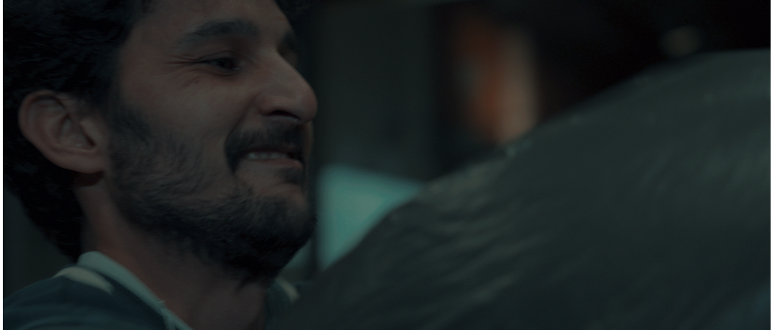
Görsel 33: Baran yakın plan

Bu bağlamda, kameranın hiçbir sahnede mutlak durağanlığa geçmemesi, anlatının merkezindeki karakterin içinde bulunduğu durumu hem ruhsal hem de toplumsal düzlemde sürekli bir kayıpla ilişkilendiren anlatı yapısını pekiştirmektedir. Film boyunca kullanılan omuz kamerası tekniği, yalnızca izleyiciyi fiziksel olarak karakterin yanına konumlandırmakla kalmayıp, onun psikolojik dağılma sürecine de doğrudan tanıklık etmesini sağlayan bütüncül bir sinematografik tercih olarak yapılandırılmıştır. Sürekli mikro düzeyde hareket hâlindeki kamera, karakterin istikrarsızlaşan içsel yapısını ve sosyal çevresiyle kurduğu gerilimli ilişkileri, görsel anlatının taşıyıcısı konumuna taşımaktadır.