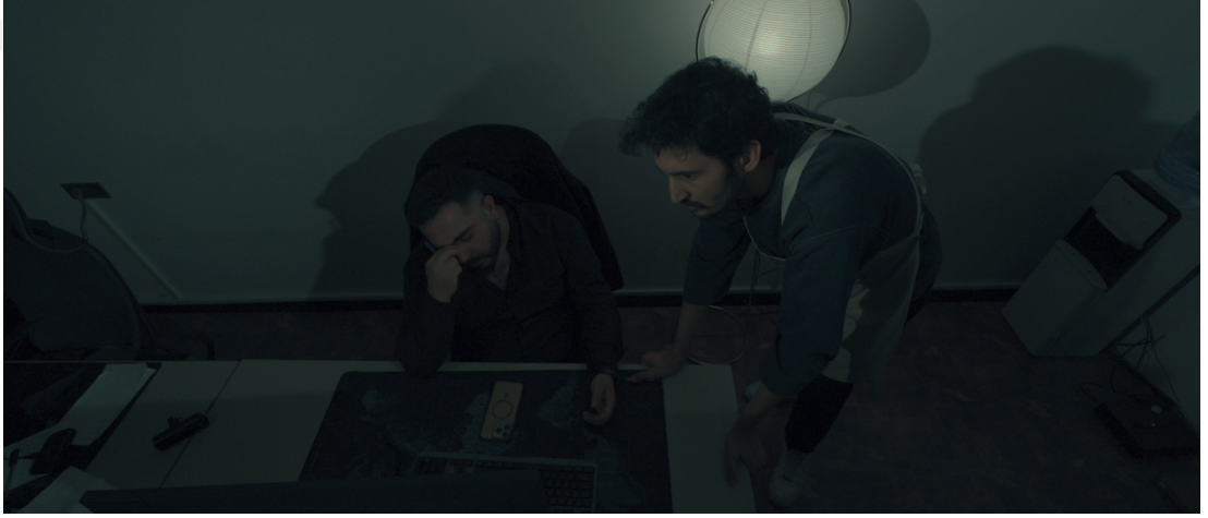
Görsel 23: Güvenlik kamerası açısı