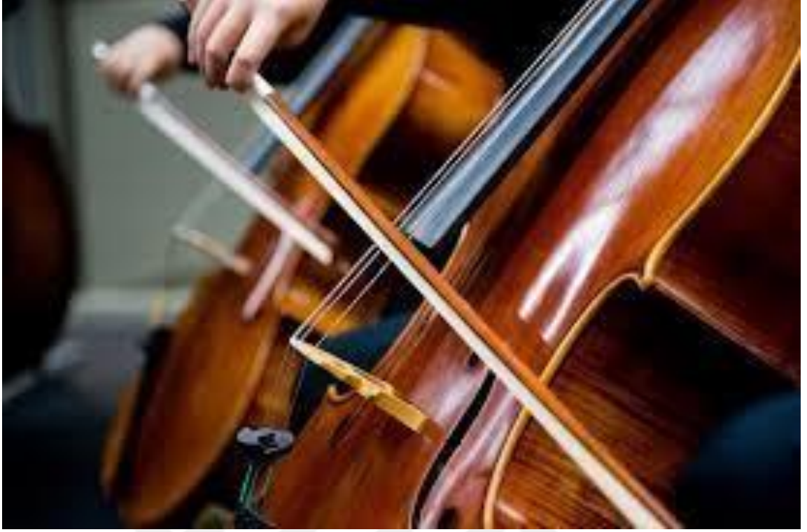
Resim 5 Yaylı Çalgılar 5

Buna ek olarak, özellikle elektronik çağda geliştirilen bazı çalgılar beşinci bir grup olan elektronik başlığı altında incelenmektedir. Bu çalgılar, ses üretiminde elektriksel bileşenleri esas alır.