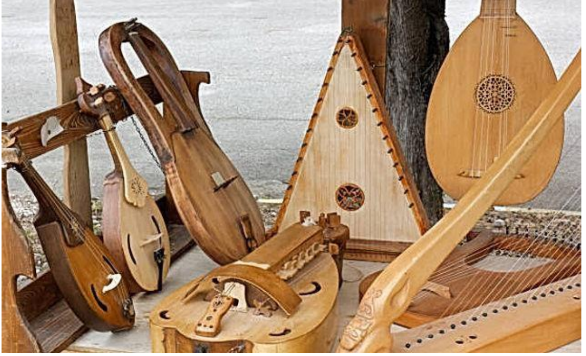
Resim 4 Telli Çalgılar 4

Çalgılar, tarih boyunca çeşitli şekillere göre sınıflandırılmıştır. Genel olarak bu sınıflandırmalar çalgının ses üretme prensibine, yapı malzemesine, çalışma tekniğine ya da kültürel kullanımına göre yapılmaktadır