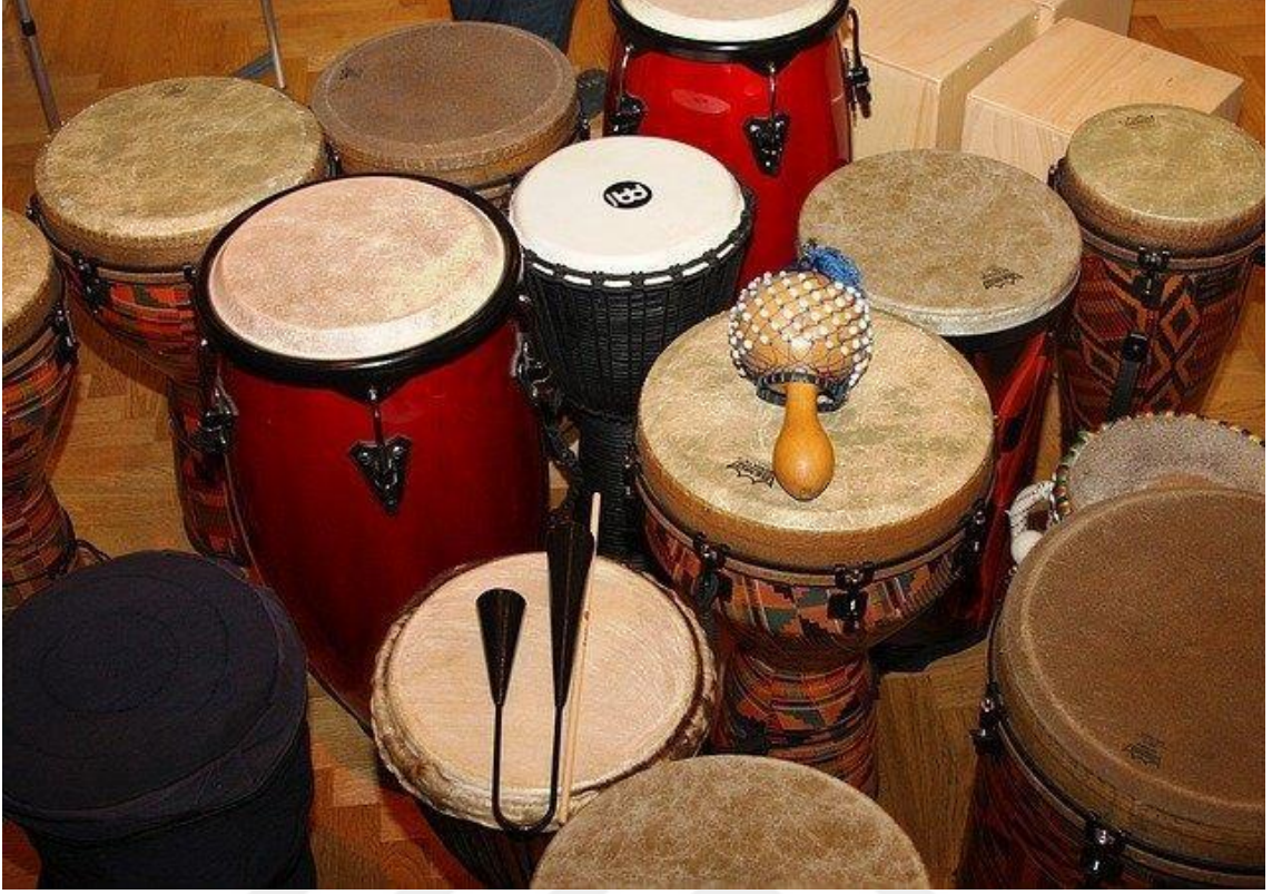
2 Resim 2 Ritim Çalgıları

Resim 1’de müzikte ritim yapısını kurmakta kullanılan ritim çalgılarından iki farklı örnek ver almaktadır. Ritim, müziğin iskeletidir. Bu iskelet farklı ulusların müziğinde farklı biçimlerde oluşabileceği gibi, aynı ulusun çeşitli müzik türlerinde de farklı biçimlerde yapılabılır (Özgür ve Aydoğan 2002: 26).