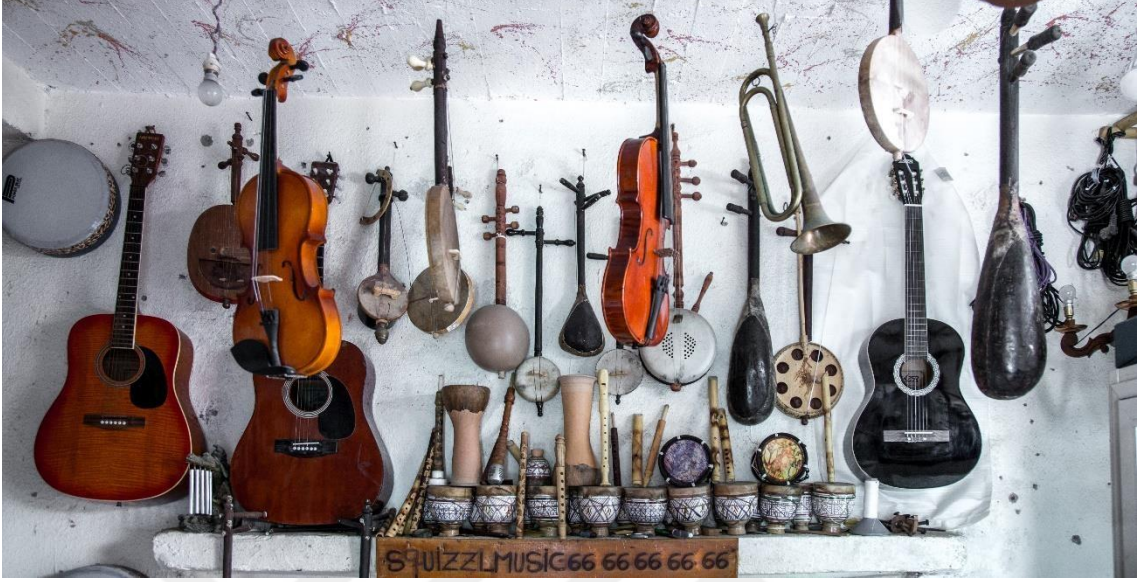
Resim 3 Çeşitli Çalgılar 3

üreticileri değil, aynı zamanda icracının kimliğini, estetik anlayışını ve kültürel birikimini yansıttığı sanat ifadeleridir.