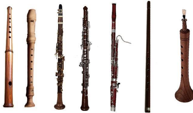
Resim 8: Üflemeli Çalgılar 8

Üflemeli çalgılar, performans sırasında nefes kontrolü, dudak pozisyonu (ambuşür), dil kullanımı (artikülasyon) ve gövde desteği gibi birçok fiziksel unsuru bir arada gerektirir. Bu durum, icracının bedenini oldukça aktif ve hassas şekilde kullanmasını zorunlu kılar. Özellikle uzun süreli performanslarda nefes yönetimi, ses kalitesi ve devamlılık açısından belirleyici rol oynar.