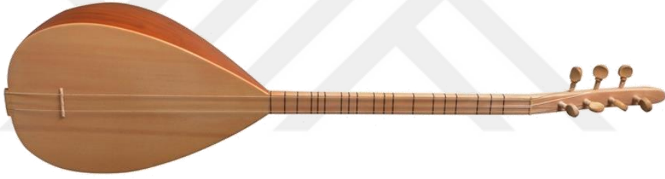
Resim 6 Telli algılar Bağlama 6

İcracı açısından bakıldığında ise telli algılar, geniş bir teknik ve duysal kontrol alanı sunar. Parmak baskısı, mızrap tekniđi, yay kullanımı ve algının yapısal özellikleri, ortaya ıkan sesin karakterini doğrudan etkiler. Bu yönüyle her icracı, algısıyla zamanla kişisel bir “ses dili” geliştirir