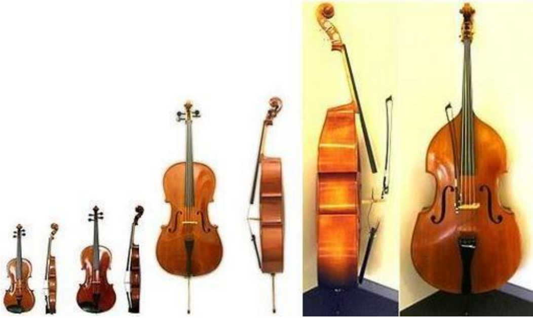
Resim 7: Yaylı Çalgılar 7

Yaylı çalgılar, icracıya yüksek düzeyde bir ifade özgürlüğü sunar. Yayın basıncı, hızı, tel üzerindeki konumu gibi faktörler, sesin rengini, yoğunluğunu ve duygusal tonunu doğrudan etkiler. Bu nedenle yaylı çalgılar, yalnızca teknik becerilerin değil, aynı zamanda yorum gücünün ve duygusal derinliğin de belirgin biçimde yansıtıldığı çalgılar olarak öne çıkar