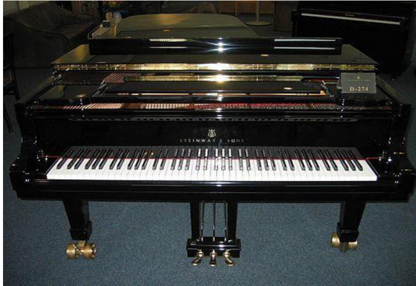
Resim 10: Tuşlu Çalgılar 10

Tuşlu çalgılar, bireysel performansların yanı sıra grup müziğinde eşlik çalgısı olarak da sıklıkla kullanılır. Piyano hem solo hem eşlik hem de doğaçlama alanlarında geniş bir repertuara sahiptir. Bu yönüyle tuşlu çalgılar, icracıya teknik becerinin yanı sıra müzikal yönlendirme, armonik destek ve anlatım gücü kazandırır.