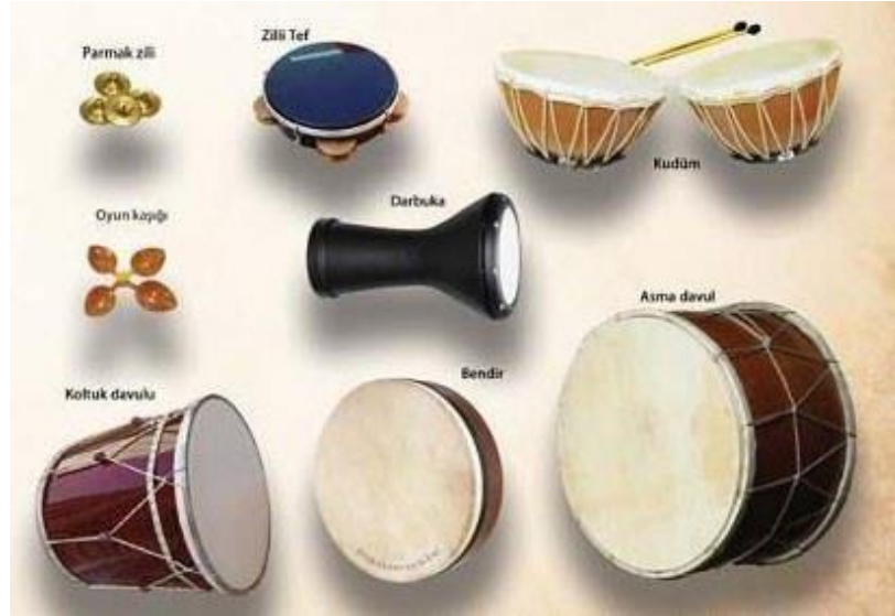
Resim 9: Vurmalı Çalgılar 9

Türk müzik kültüründe ritim çalgılar önemli bir yere sahiptir. Özellikle davul, def, bendir, tef, darbuka gibi çalgılar hem halk müziği icralarında hem de geleneksel törenlerde sıkça kullanılır. Bu çalgılar yalnızca ritmik yapı sağlamakla kalmaz, aynı zamanda toplumsal kimlik, coşku ve duygusal aktarım açısından da güçlü semboller haline gelmiştir. Bu nedenle ritim çalgıları, yalnızca teknik bir müzikal unsur değil, aynı zamanda kültürel bir ifade biçimi ve kolektif müzik üretiminin vazgeçilmez ögesidir.