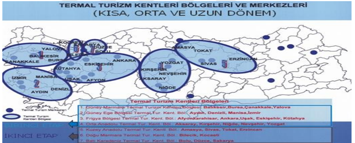
Resim 1. Türkiye termal turizm kentleri haritası ( http://www.ktbayatirimisletmeler.gov.tr , 2019).

Kültür ve Turizm Bakanlığı tarafından hazırlanan Termal Turizm Master Planında, termal turizmin geliştirilmesi amacıyla "Termal Turizm Kentleri" projesi ile ülkemizdeki jeotermal potansiyeller dikkate alınarak yeni bölgesel alanlar tespit edilmiştir. Bölgelerdeki illerin belirlenmesinde coğrafi olarak termal kaynakların yanı sıra ortak kültürel ve doğal güzellikleri barındırması, ortak ulaşım olanakları, uygun iklim koşulları ile birlikte bir termal destinasyon oluşturabilecek niteliklerde olması dikkate alınmıştır. Bu özellikler bakımından termal turizm kentleri resim 1'de belirtilmektedir. ( http://yigm.kulturturizm.gov.tr , 2019)