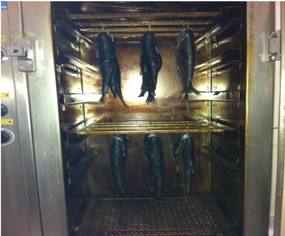
Şekil 3.3. Tütsüleme fırını