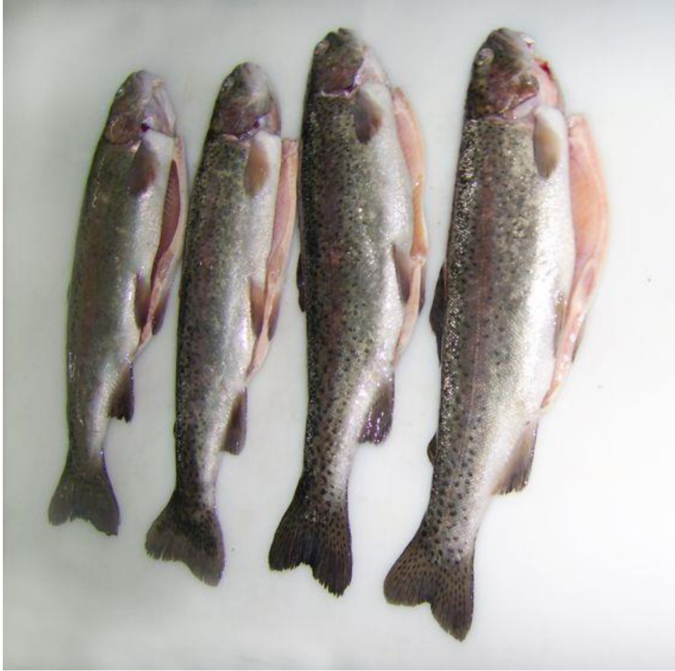
Şekil 3.1. Dumanlama işleminde kullanılan taze gökkuşağı alabalıkları ( Oncorhynchus mykiss )

Araştırmada, balık materyali olarak kullanılan alabalıklar özel bir işletmeden temin edilmiştir. Gramajları 250-300 gr arasında değişen pazar boyu 45 adet gökkuşağı alabalığı ( Oncorhynchus mykiss ) kullanılmıştır.