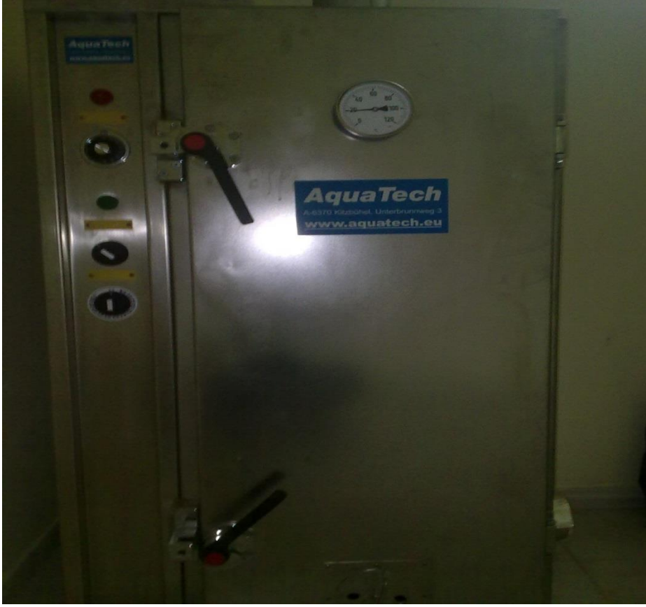
Şekil 3.2. Tütsüleme fırını