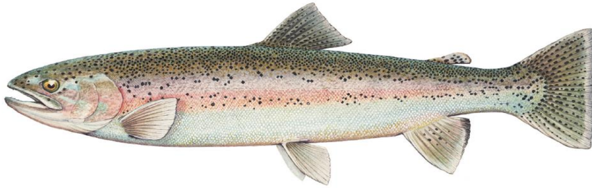
Şekil 2.1. Gökkuşığı alabalığı ( Oncorhynchus mykiss ) (Anonim, 2014)

Alem : Animalia Şube : Chordata Sınıf : Actinopterygii Takım : Salmoniformes Familya : Salmonidae Cins : Oncorhynchus Tür : Oncorhynchus mykiss