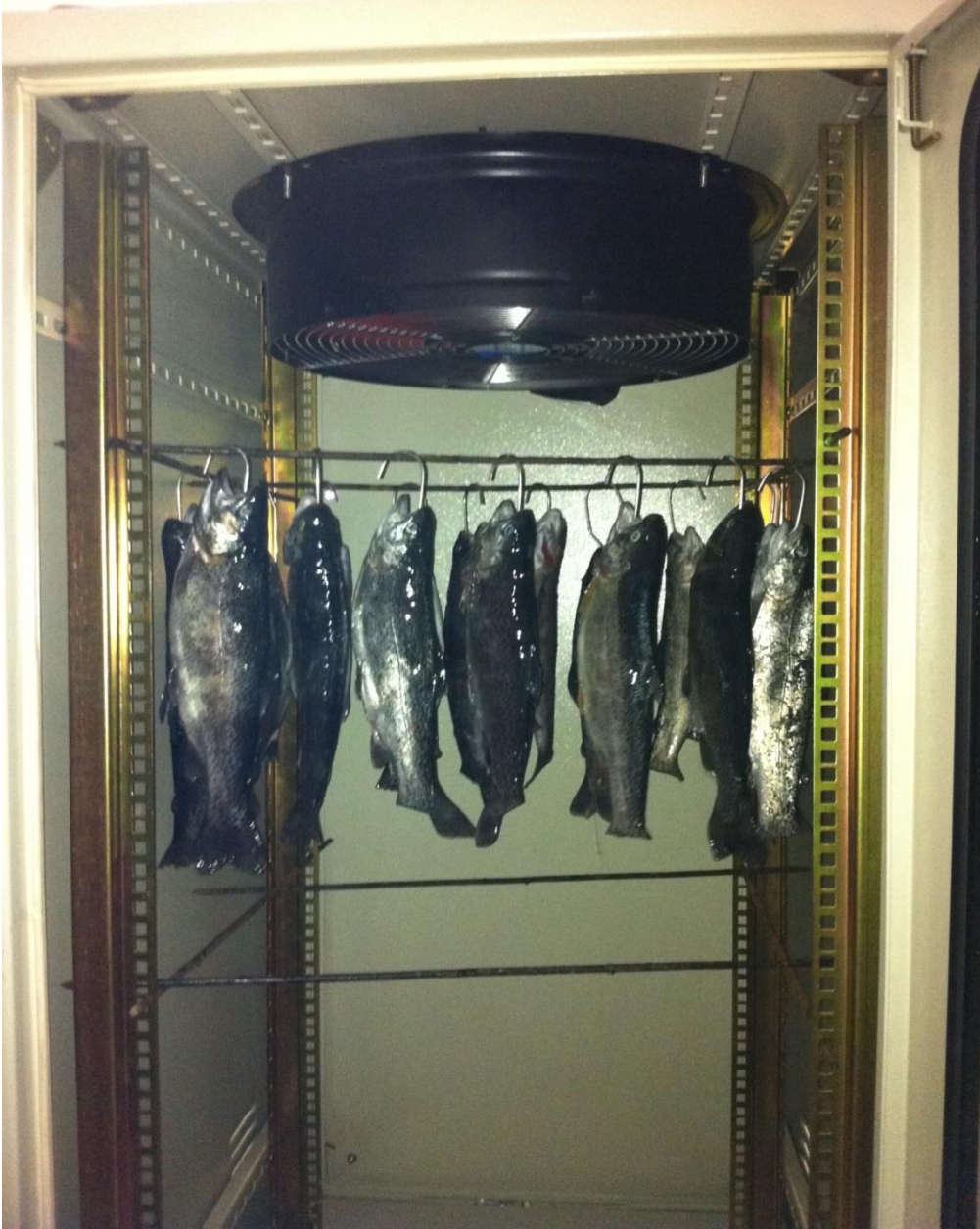
Şekil 3.4. Kurutma dolabı