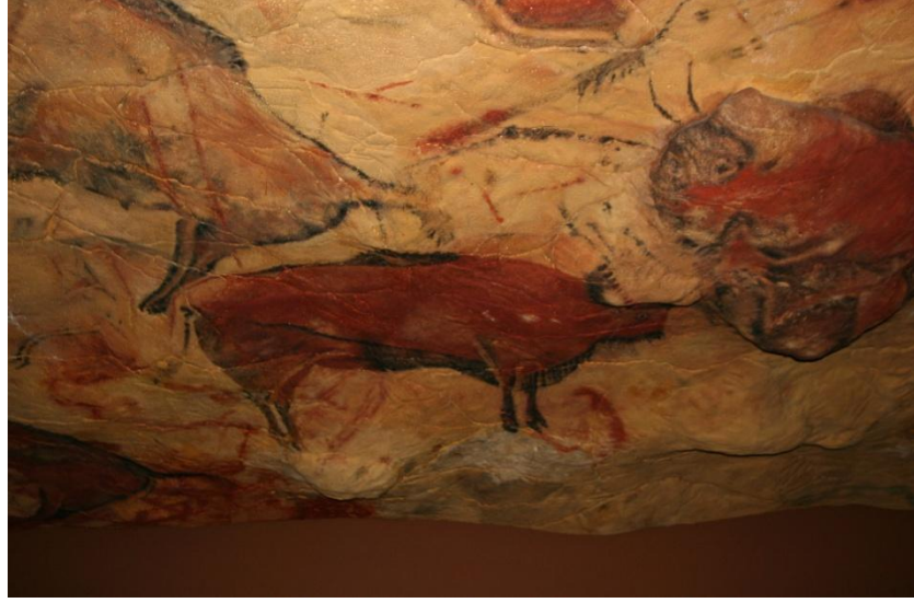
Resim 2.1. Altamira mağarasının reproduksiyonu “Deutsches Museum, Münih

“Mekan, Arapça kökenli bir kelime olup; kane filinden ve kevn mastarından türemiştir. Kelime anlamı olarak “olmak, oluşmak, var olmak, ortaya çıkmak anlamlarını taşımaktadır.” 3