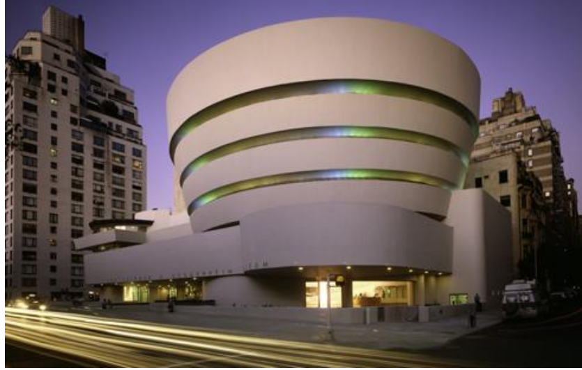
Resim 4.8. Solomon R.Guggenheim Müzesi -Frank Lloyd Wright