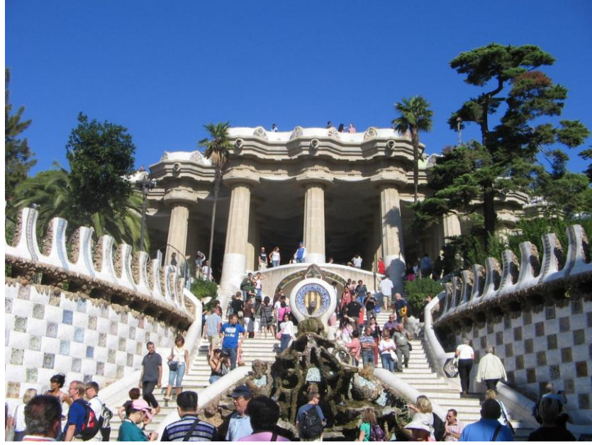
Resim 4.2. Park Güell- Gaudi /BARCELONA