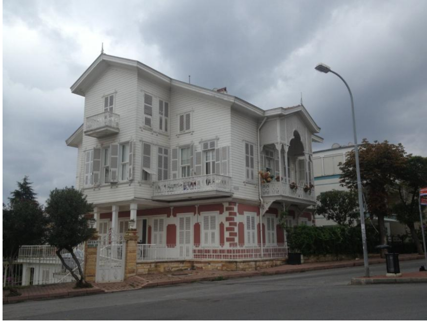
Resim 2.3. Büyükada' da bir köşk