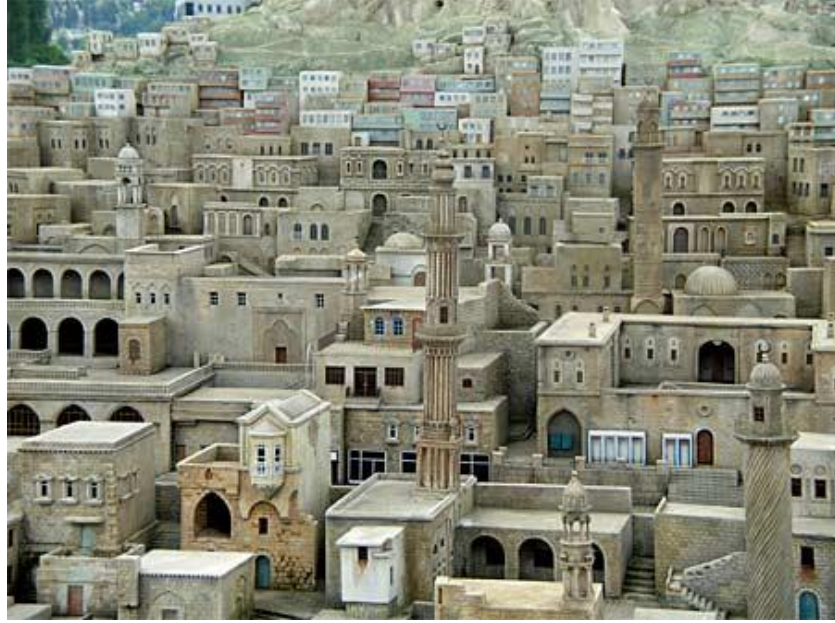
Resim 2.8. Mardin Evleri