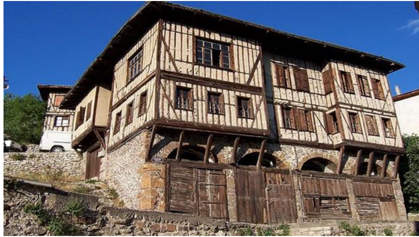
Resim 2.9. Karadeniz Evleri

Mardin evlerinde sarı kalker taşının kullanılma sebebi bölgede çok fazla bulunmasıdır. Evlerin duvarlarının 4m. olması ise sert iklime karşı korunma sebebiyledir. 8