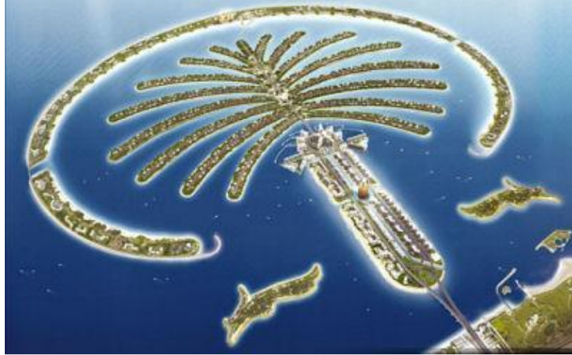
Resim 2.13. Dubai Palmiye Adası

Mekan tasarımında rol oynayan çeşitli zorluklar, ekonomik koşulların sağlayabildiği kolaylıklar ile zorluk olmaktan çıkabilmektedir.