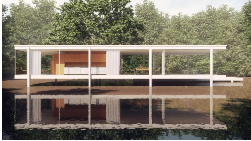
Resim 5.1. Ludwig Mies Van Der Rohe-Barcelona Pavilion

Tasarımcı hatta kullanıcı en iyiye ulaşabilmek için teknoloji başta olmak üzere birçok faktörden yararlanır. O güne değin denenmemiş tarzlar, kullanılmamış malzemeler, farklı tasarımlarla yapılmış kimi tasarımlar hemen dikkat çekerken kimileri zamanla, kullanıldıkça dikkat çekebilir. Önemli olan tasarımın ne amaçla yapıldığı, doğru yapılması, kendine özgü olabilmesidir.