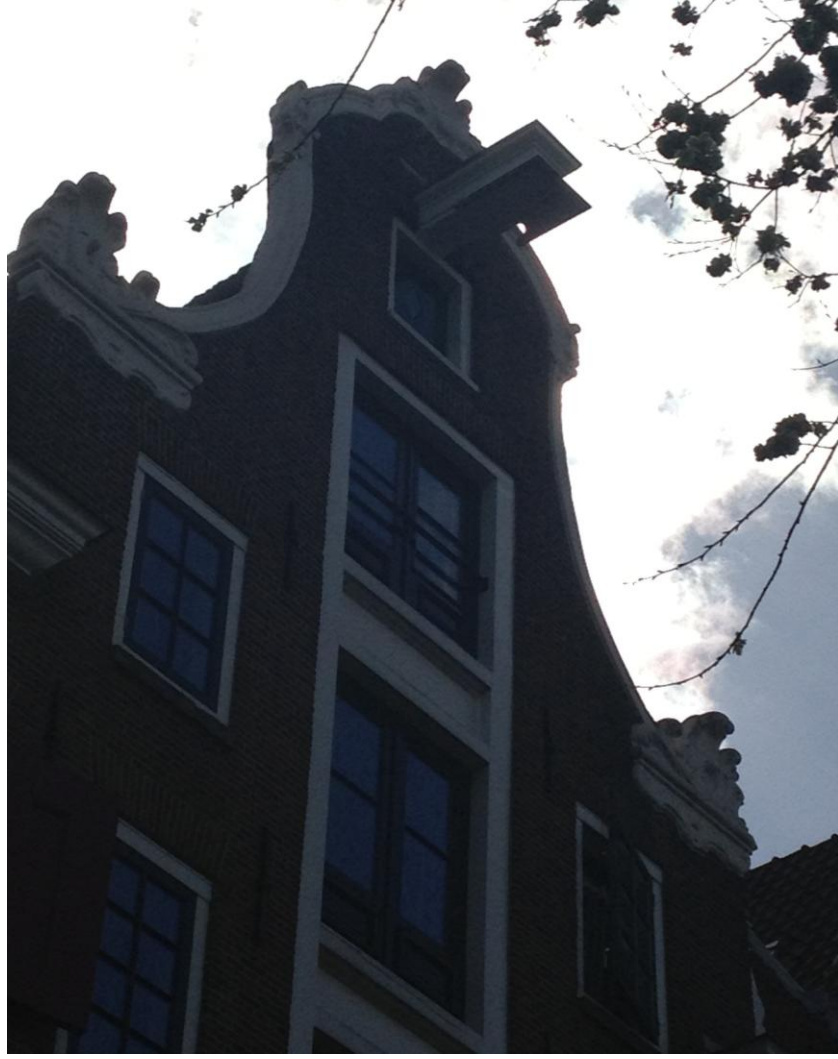
Resim 2.17. Amsterdam evlerine camlardan eşya sokmaya yarayan kanca