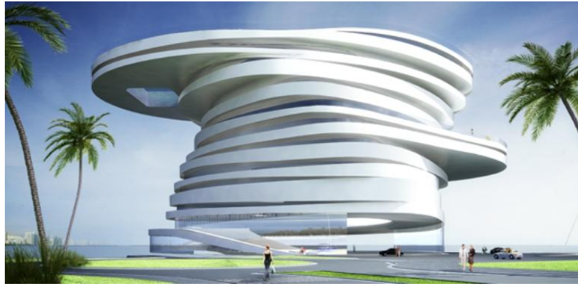
Resim 2.12. Helix Hotel

New York'ta genel olarak çelik iskelet sistemi ile yapılan çok katlı binalar.