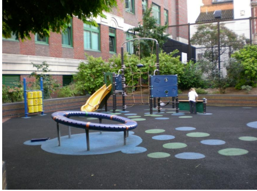
Resim 2.4. Londra' da çocuk oyun alanı