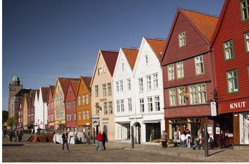
Resim 2.6. Sert bir iklime sahip Norveç’te çatıların genel görünümü

Zorlu iklim koşulları binaların dik çatılı olmasını gerektirip, o bölgeye kendine özgü bir hava katmıştır. Sıcak iklimlerde çatı bir gereksinim olmaktan çıkmış evlerin görünümü farklı bir hale gelmiştir.