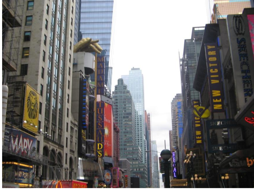
Resim 2.11. New York Times Square