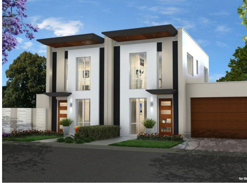
Resim 2.7. Güney’de yazlık bir ev

Zorlu iklim koşulları binaların dik çatılı olmasını gerektirip, o bölgeye kendine özgü bir hava katmıştır. Sıcak iklimlerde çatı bir gereksinim olmaktan çıkmış evlerin görünümü farklı bir hale gelmiştir.