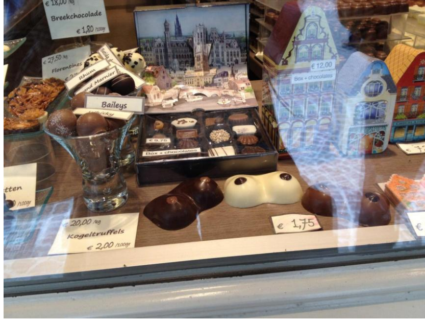
Resim 2.20. Brugge’da bir ikolata dkkanı/ Belika