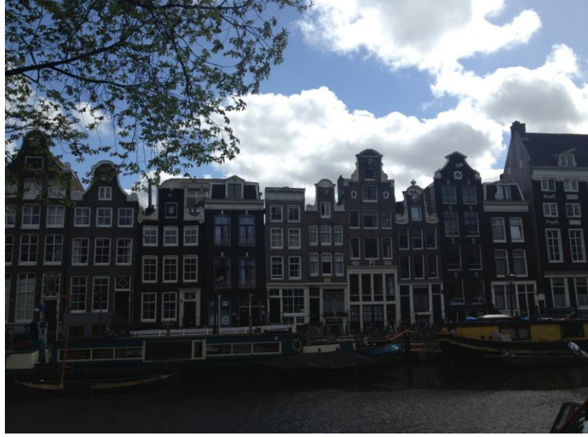
Resim 2.18. Bitişik nizam ve dar yapılı Amsterdam evleri

Kendi içlerinde çok da farklı olmayan evler bir araya geldiklerinde diğer şehirlerden ayırt edilir hale gelmektedir.