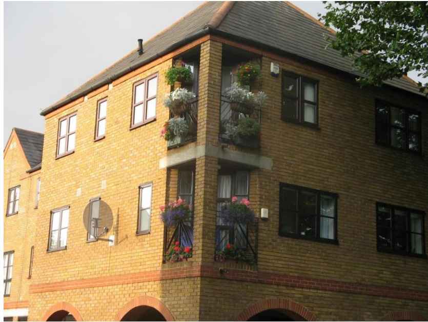
Resim 3.1. Londra’da balkon düzenlemeleri

Kullanıcı ile birlikte hareket eden tasarımcı ya da kullanıcının tamamen kendi tercihleriyle oluşmuş mekanlarda kimlikte kendiliğinden meydana çıkmış olur. 17 Bir apartmanı düşündüğümüzde her bir mekan kullanıcısının ihtiyaçlarını, beğenilerini, zevklerini de mekana yansıttığını görürüz ve böylece aynı mekanlarda, farklı yaşamlar ve oluşan farklı mekan kimliklerine şahit oluruz. Apartmandaki her bir dairedeki bambaşka yaşamlar bambaşka mekanlara dönüşür. Bütün bir sokağın kırmızı tuğla binalardan oluştuğu bir Londra mahallesinde mekanları tek farklı kılan kullanıcıların beğenisi ile şekillenmiş balkonlar ve pencere önleri olmuştur.