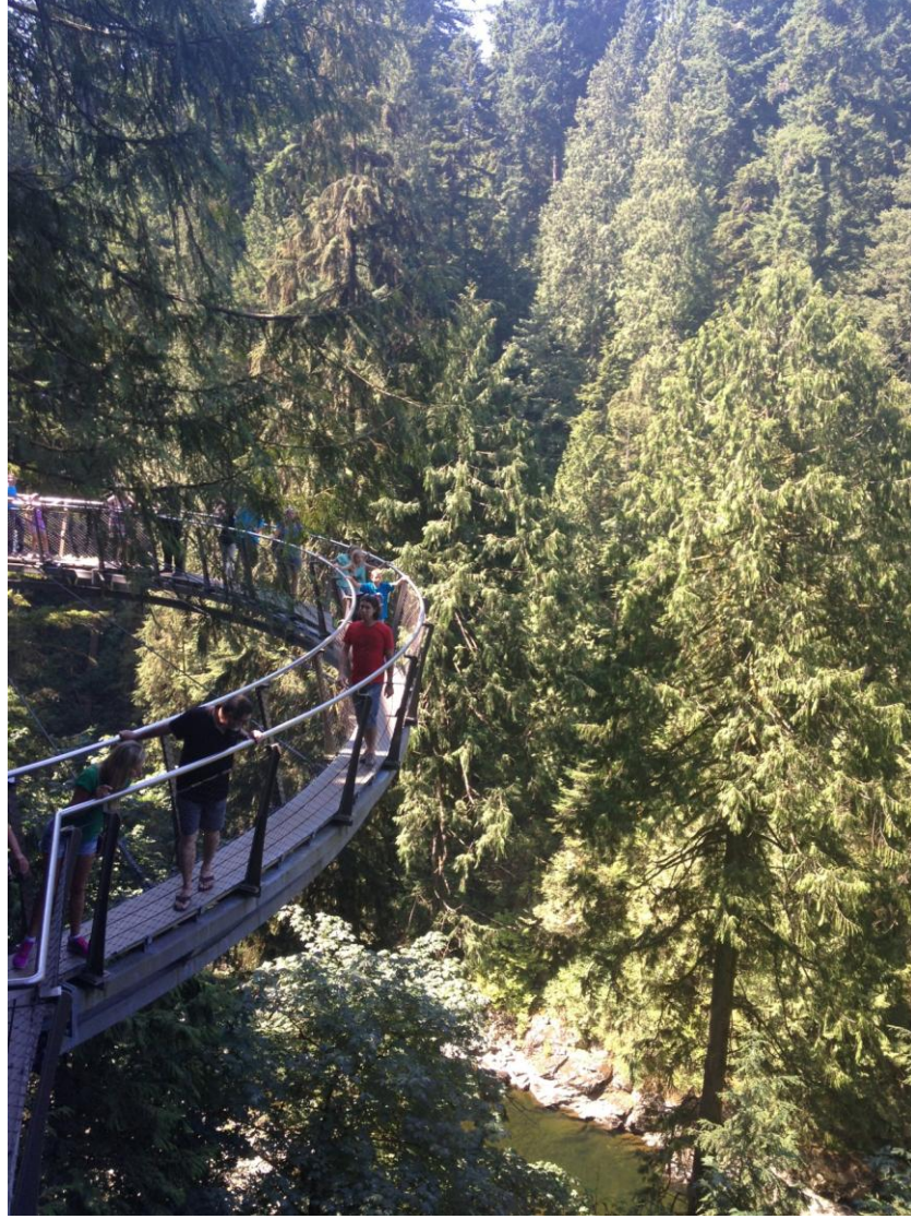
Resim 2.10. Capilano parkı içindeki köprü Vancouver/KANADA

Capilano Park'ı içinde yer alan fotoğraftaki köprü ormanların muhteşem görüntüsünün rahatça izlenmesini olanaklı kılmaktadır. Her yıl yüzlerce turist dünyanın en korkunç köprüsü kabul edilen Sallanan köprüyü ve fotoğraftaki köprüyü görebilmek ve bu atmosferi rahatça yaşayabilmek adına Capilano Park'a gitmektedir.