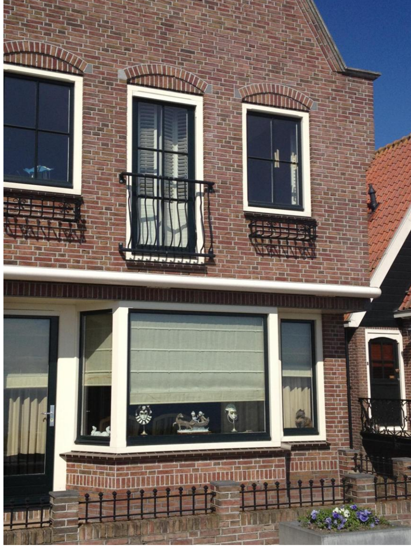
Resim 3.2. Volendam pencere düzenlemeleri /Hollanda