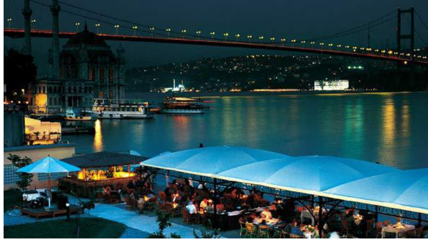
Resim 2.19 Boğaz manzaralı restaurant/İSTANBUL

Kendi içlerinde çok da farklı olmayan evler bir araya geldiklerinde diğer şehirlerden ayırt edilir hale gelmektedir.