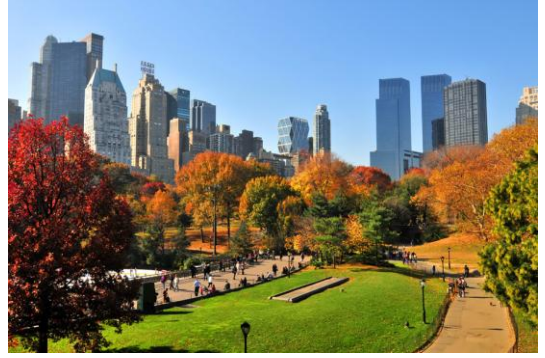
Resim 2.16. Central Park/New York