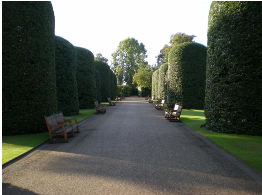
Resim 2.5. Londra' da bir park