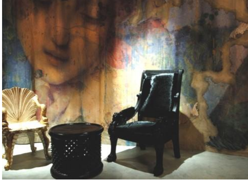
Resim 4.6. Le Lan, Phillipe STARCK /ÇİN