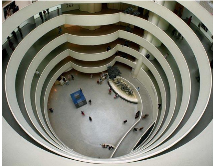
Resim 4.9. Solomon R.Guggenheim Müzesi -Frank Lloyd Wright