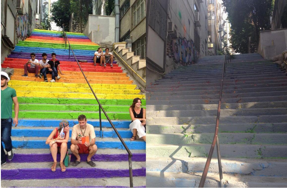
Resim 2.21. Boyanmış merdivenler/İSTANBUL

ikolatanın her eřit ve ekilde yapıldığı Belika’nın Brugge ehri akla dřtğnde sokaklarında ki ikolata kokusu da burna dřmektedir.