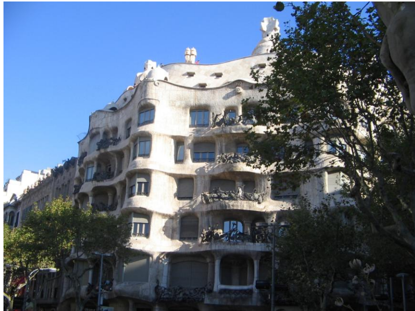
Resim 4.3. Casa Mila- Gaudi/ Barcelona