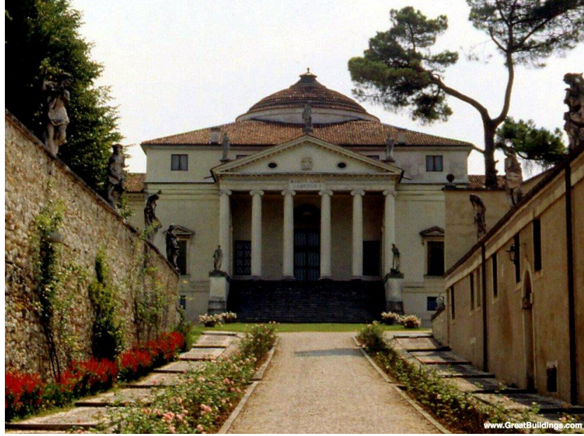
Resim 4.10. Villa Capra- Andrea Palladio