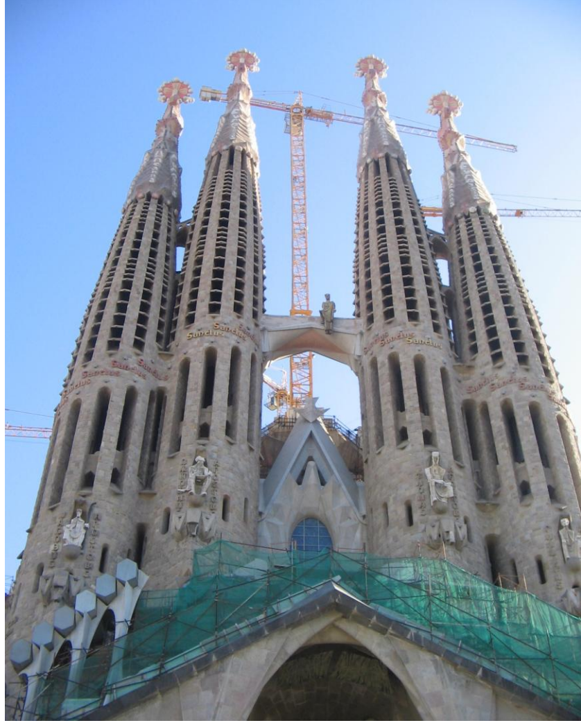
Resim 4.1. La Sagrada Familia-Gaudi /BARCELONA