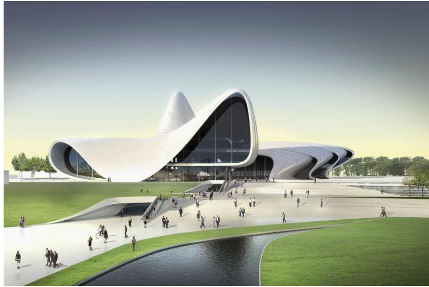
Resim 4.5. Haydar Aliyev Kltr Merkezi-Zaha Hadid