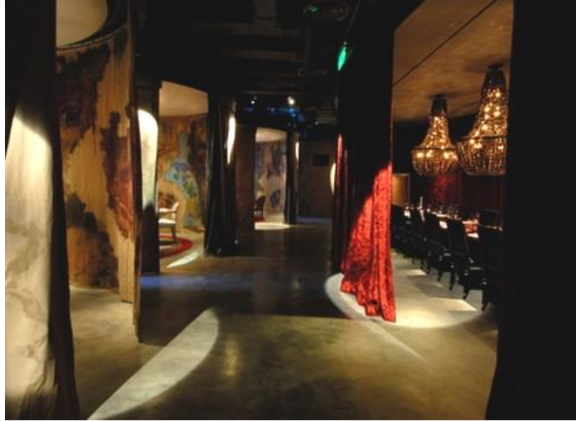
Resim 4.7. Le Lan, Phillipe STARCK /ÇİN