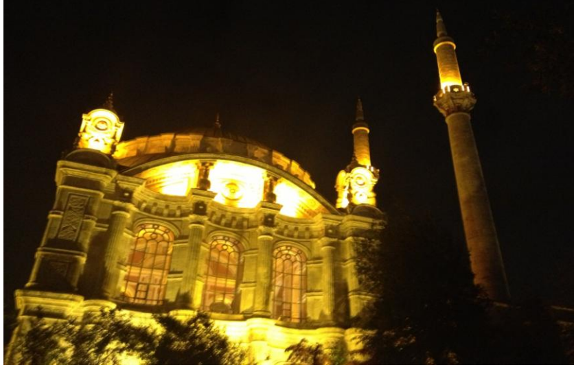
Resim 2.2.Ortaköy camii