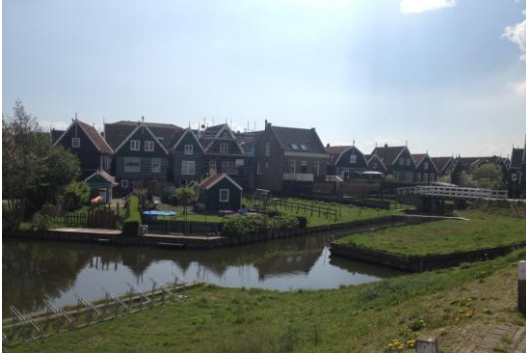
Resim 2.14. Alışık olduğumuz köylerden farklı Hollanda' da Marken köyü

Her mevsim ayrı güzel olan New York' daki Central Park estetik olduğu kadar şehre nefes alma imkanı sağladığından dolayı işlevseldir de.