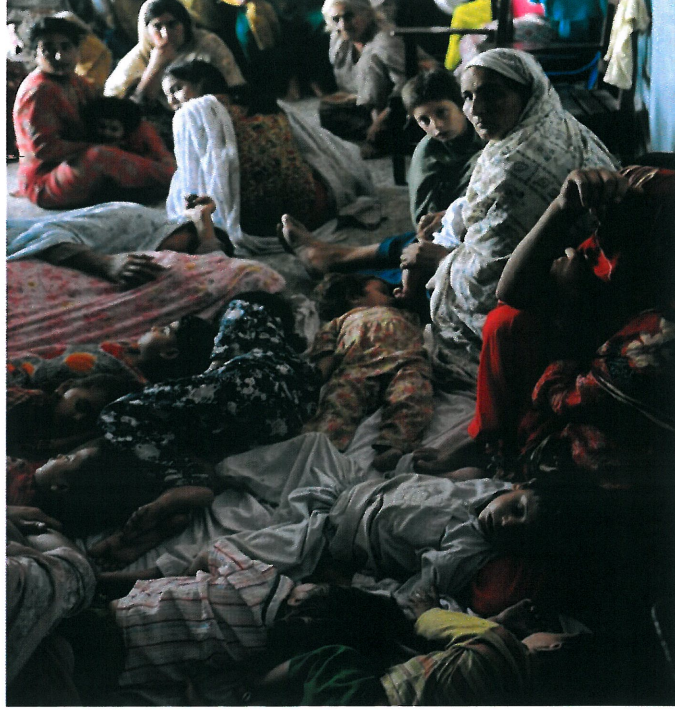
Resim 3. www.windsorstar.com , “İsimsiz”