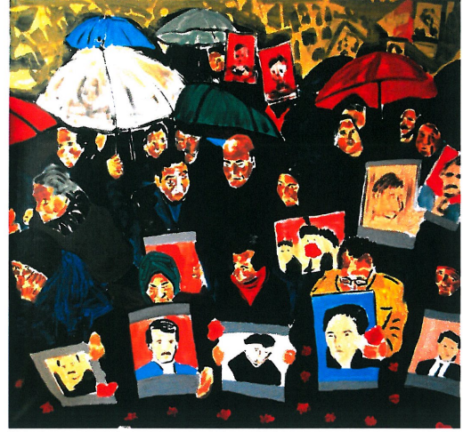
Resim 18. “Cumartesi Anneleri”

Resim 17’deki gazete görselinden yola çıkılarak yapılan Resim 18’deki çalışmada, yağmurlu bir günde eylem için toplanmış insanlar görülmektedir. Resimde iç içe girmiş birbirlerine destek vermektedirler ve bir hüznün ortamı egemendir. Arka plan net olmayan bir biçimde eritilerek resim tamamlanır. Figürler siyahlar içindedir. Siyah içindeki figürler kayıp yakınlarının üzüntüsünün bir yansımasıdır. Resimde ön planda kaybolan yakınlarını anmak için atılmış karanfiller kayıplarının simgeleri gibi düşünülmüştür.