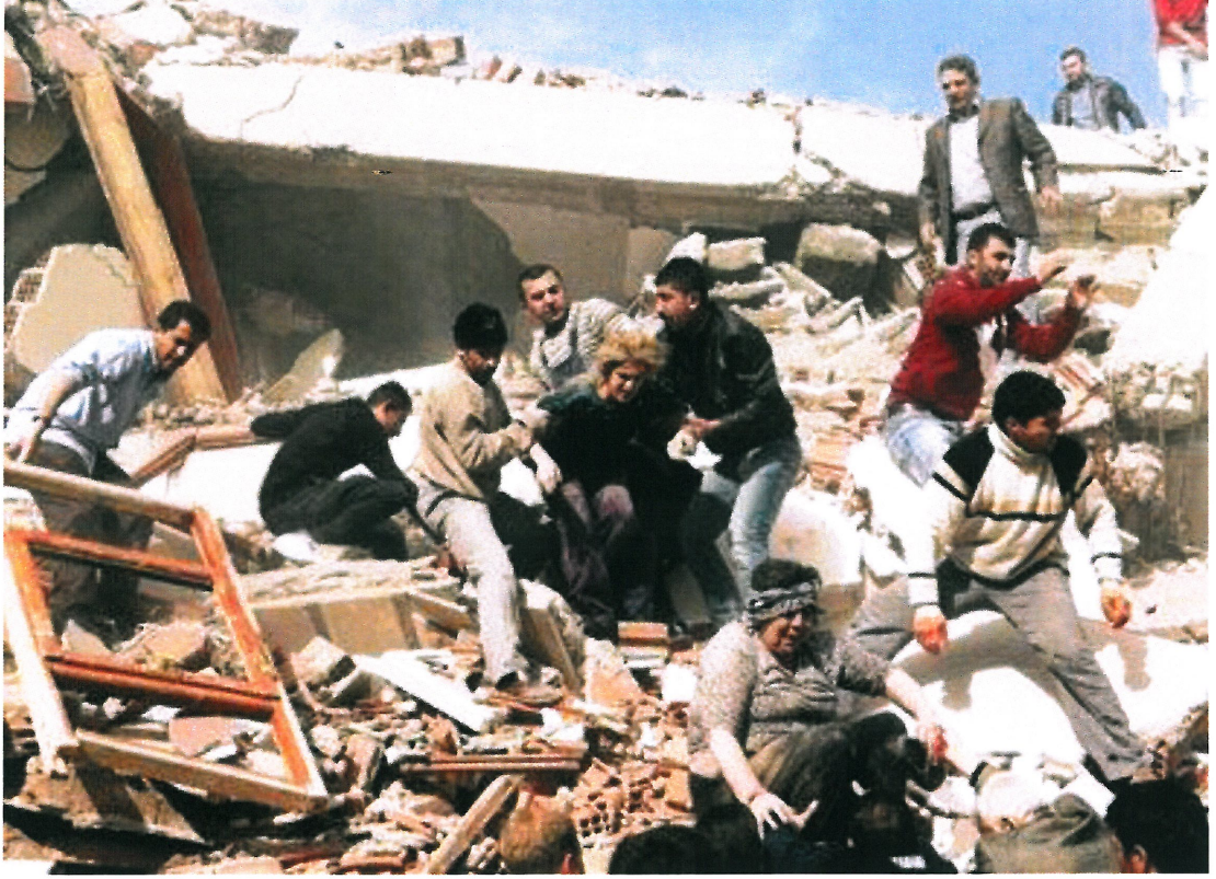
Resim 7. “İsimsiz”