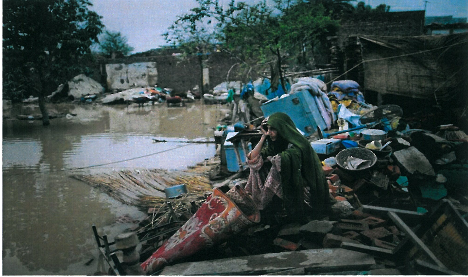
Resim 1. Daniel Berehulak, “İsimsiz”