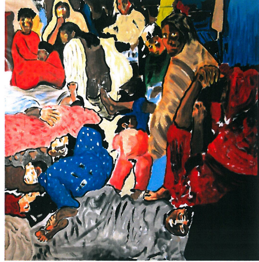
Resim 4. "Bekleyiş"

Resim 3 'deki gazete görselinden yola çıkılarak yapılan Resim 4 'deki çalışma, tuvale ters "s" biçiminde sıralanmış figürlerden oluşmaktadır. Kompozisyonun ana karakterleri, resmin ortasına konumlandırılmış ve izleyene bakan anne ve çocuktur. Kadınların, bebeklerin tuval düzlemine serpilmişçesine aktarılması fotoğraf karesinde de gözlenen doğal yıkımın vurgulanabilmesi içindir. Figürlerdeki umutsuzluğun anlatımı için yüzlerde kararar koyu renk değerleri kullanılmıştır. Resimde öndeki ve arka plandaki figürler olmak üzere iki plan oluşturulmuş olmasına karşın derinlik ve uzam boşluk doluluk ve renkçi bir anlayışla verilmiştir. Açık- koyu renk karşıtlığı, resimdeki ışık algısını ve yalnızca renklerin ışık oranları ile dışa vurarak resmin kendine özgü dili ile bir derinlik yaratılmak istenir.