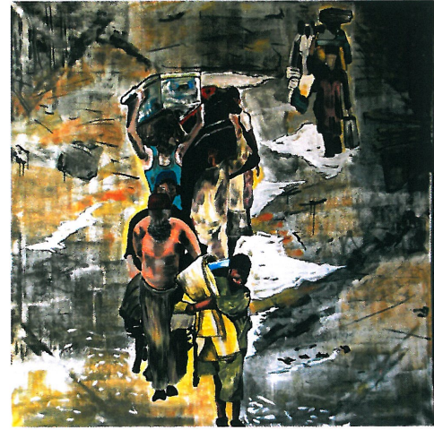
Resim 6. "Selden Kaçış"

Resim 5 'deki gazete görselinden yola çıkılarak yapılan Resim 6 'daki çalışma, grileşmiş renkler ve açık değerler yoğunludur. Resmin kurgusal mekan ve yerleştirimi; arka alanda perspektif içinde küçülmüş izlenimi yaratan figürler ile önde yakınlaşmış gibi görünen figür gruplarından oluşmakta ve resmin ortasından kesilmeye neden olmaktadır. Resim 5 ile neredeyse birebir kurgu ve yerleştirmenin