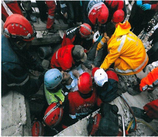
Resim 9. “İsimsiz”

Resim 9’da, 23 Ekim 2011 Pazar günü öğle saatlerinde Van’da meydana gelen 7.2 şiddetindeki depremde yüzlerce insan hayatını kaybetmiştir. Depremın en büyük hasara yol açtığı Erciş’te yıkılan binalarda göçük altında kalanları kurtarmak için arama ve kurtarma ekipleri çalışmalarını aralıksız sürdürmüştür (www.kulturelbellek.com [24.11.2013]).