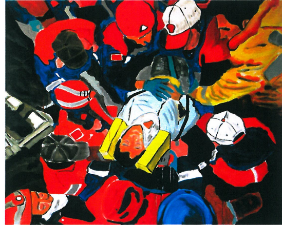
Resim 10. “Yeniden Doğuş”

Resim 9’daki gazete görselinden yola çıkılarak yapılan Resim 10’daki çalışma, göçük altından çıkarılan bir depremzedenin görüldüğü kompozisyondan oluşur. Kompozisyona hakim renk olan kırmızı rengin dağılımı oradaki can pazarının önemine sembolik bir anlam katmaktadır. Resim 10’un odak noktası sedyede yatan depremzededir. Figür dağılımı ve figürlerin birbirleriyle olan hiyerarşik sıralaması resme derinlik kazandırmıştır.