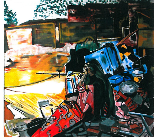
Resim 2: "Çaresizlik"

Resim 1 'deki gazete görselinden yola çıkılarak yapılan Resim 2 'deki çalışma, yağlıboya tekniğiyle yapılmıştır. Kompozisyon, fotoğraftan alınan bir kesitin tuval düzlemine aktarılmasıyla oluşturulmuştur. Kurguda, figür ortaya çekilmiş ve arkadaki net olmayan alandan ayrılmıştır. Aydınlık bir gökyüzü ve perspektif doğrultusunda konumlandırılmış nesnelere, Resim 2 'deki dengeyi oluşturmaktadır.