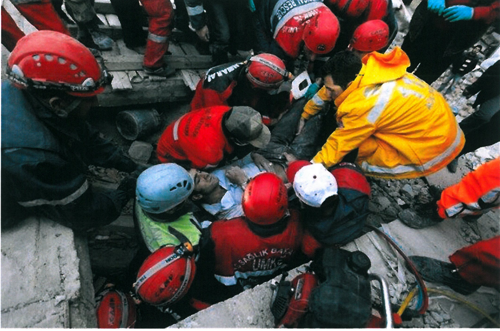
Resim 9. www.kulturelbellek.com , “İsimsiz”