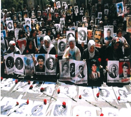
Resim 17. “İsimsiz”