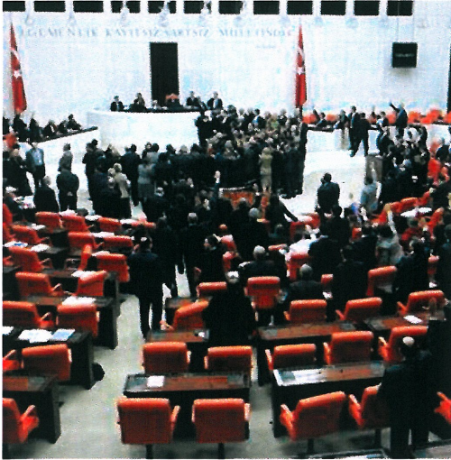
Resim 13. "İsimsiz"

Resim 13 'de, 08 Şubat 2012'de içtüzük deęişiklik teklifi TBMM'ye sunulmuştur. İçtüzük deęişikliğiyle muhalefetin sesinin kesildiğini savunan CHP'liler, teklifin görüşmelerini engellemek için genel kurulda 5 saat süreyle kürsüyü işgal etmiş, slogan atarak TBMM Başkanı Cemil Çiçek'i istifaya çağırmıştır. Kavga ise 5 saatlik işgalin ardından Çiçek'in birleşimi kapatması sonrası başlamıştır. Kürsü çevresinde ve genel kurulun muhtelif yerlerinde AK Parti ve CHP milletvekilleri, Meclis tarihinde görülmedik biçimde yumruklaşarak kıyasıya kavga etmiştir (www.haberturk.com, [20.11.2013]).