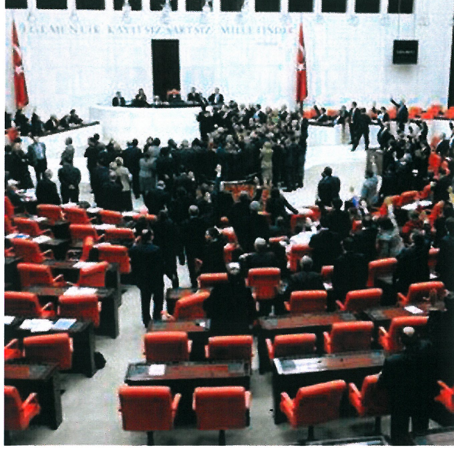
Resim 13. “İsimsiz”