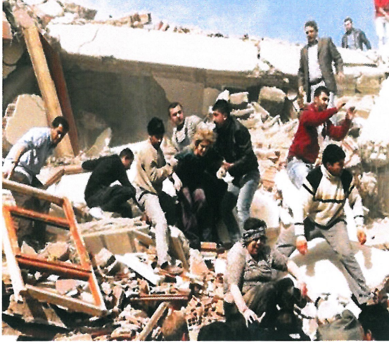
Resim 7. "İsimsiz"