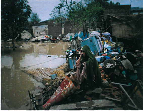
Resim 1: "İsimsiz"

Resim 1 'de, Pakistan'da 2010 yılı Temmuz ayı sonlarında başlayan muson yağmurları son yılların en büyük sel felaketine neden olmuştur. Muson mevsiminde olan Pakistan bu yıl önceki yıllara göre tüm bölgelerde 4 ila 10 kat daha fazla yağmur almıştır. Yağmurlar ülkenin kuzeyinde bulunan Keşmir eyaletinde başlamış, kuzeyden güneye ülkedeki beş eyaletin dördünden geçen İndus Nehri'nin taşmasına neden olmuştur. Taşkınım ilk etkileri Keşmir ve Kuzeybatı Sınır Eyaleti'nde hissedilmiştir. Yağmurların diğer eyaletlerde başlaması ile birlikte orta eyalet Pencab ve daha güneydeki Sind eyaletinde de selin etkisi büyük olmuştur. Ülkenin yaklaşık olarak beşte biri sular altında kalmıştır. 17 milyondan fazla kişinin etkilendiği sellerde 2000 civarında kişi hayatını kaybetmiştir (www.mathrubhumi.com [20.11.2013]).