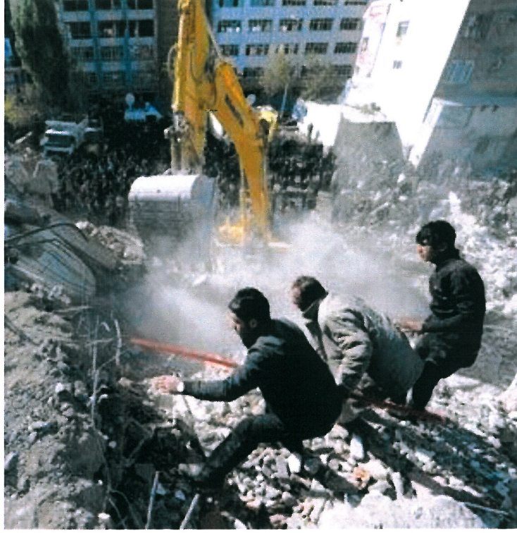
Resim 11. www.dogruhaber.com , “İsimsiz”