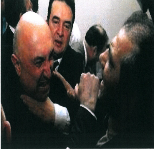
Resim 15. "İsimsiz"