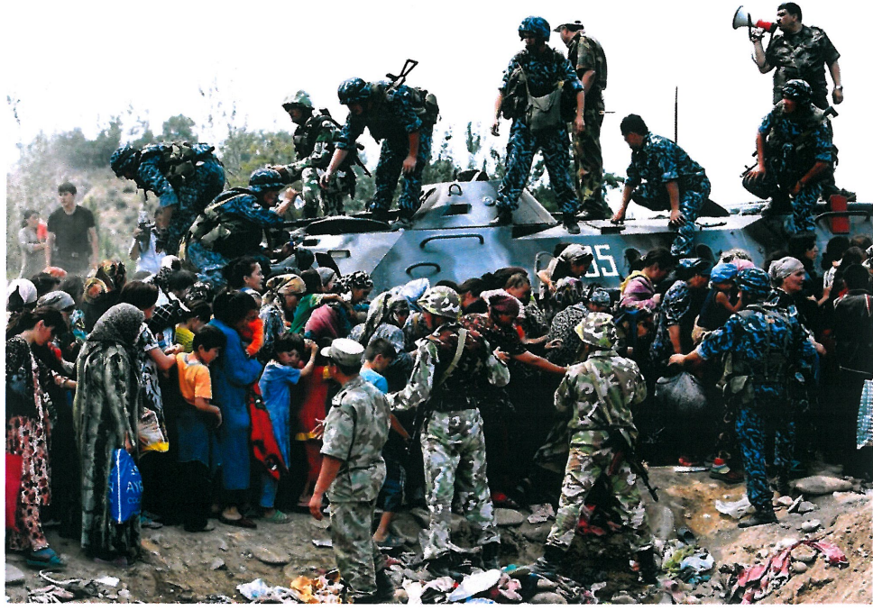
Resim 19. www.theguardian.com , “İsimsiz”