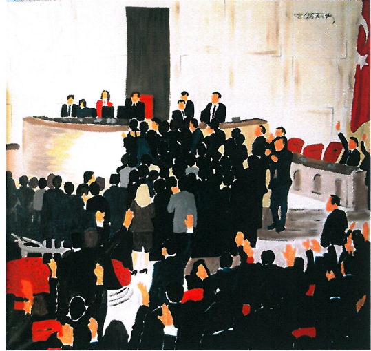
Resim 14. "Meclis"

Resim 13 'deki gazete görselinden yola çıkılarak yapılan Resim 14 'deki çalışma; milletvekilleri, büyük bir toplantı salonu, koltuklar ve bir Türk bayrağı yer almaktadır. Figürler resmin orta bölümünde ve ön planda yoğunluktadır. Arka planda ise büyük bir boşluk yer almaktadır. Bu boşluk resmin sağından ön plana kadar uzanmaktadır. Bu ışıklı alan, izleyicide bir derinlik hissi uyandırmaktadır. Siyah rengin yoğunluğu, arka plandaki ışıklı duvar ile dengelenmiştir. Resim 14 'ün sağındaki kırmızı Türk bayrağı, sol taraftaki çiçekli alan ve resmin tamamına dağılmış turuncu koltuklar ile renk dengesi oluşturulmuştur. Diğer renklere göre