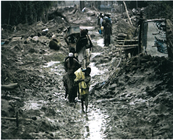
Resim 5. "İsimsiz"

Resim 5 , Pakistan'da 2010 yılında meydana gelen, çok sayıda can ve mal kaybının yaşandığı sel felaketinde ülkenin büyük bölümü sular altında kalmıştır. Sel sularının güneye doğru ilerlemesiyle birlikte birçok insan evlerini terk etmek zorunda kalmıştır. Fotoğraftaki insanlar da yanlarına alabildikleri kadar çok eşyayı alarak daha güvenli bir yere sığınmak için yol almaktadırlar.