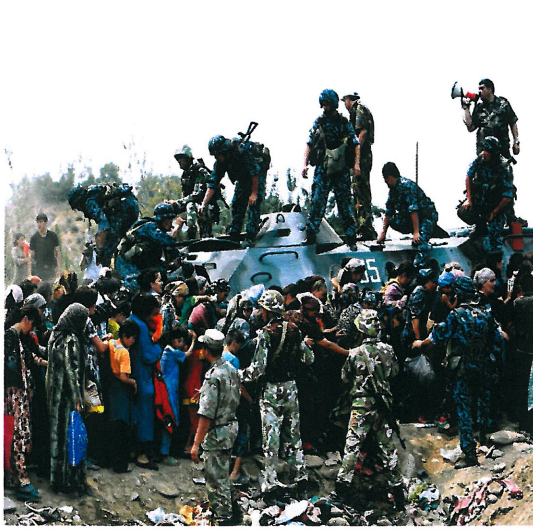
Resim 19. "İsimsiz"

Resim 19 'da, Kırgızistan'ın güneyinde 11 Haziran 2010 gecesi belirlenemeyen bir sebepten dolayı Kırgızlar ile Özbekler arasında bir çatışma meydana gelmiştir. Özbekler ve Kırgızlar arasındaki çatışma günlerce devam etmiş, yüzün üzerinde kişi hayatını kaybetmiştir. Oş ve Celalabad kentlerinde patlak veren etnik çatışmalar sonrasında can güvenliği gerekçesiyle mülteciler Özbekistan'a geri dönmüştür. Mülteciler, yaklaşık on gün sonra ise tekrar Kırgızistan'a dönmüştür. Özbekistan'daki mülteci kamplarında geçici olarak 75 bin civarında mülteci yaşamıştır. Fotoğrafta ise Oş kentinden sınırı geçerek Özbekistan'a ulaşmayı bekleyen ve zırhlı bir askeri aracın etrafında toplanan mülteciler görülmektedir (www.theguardian.com, [24.11.2013]).