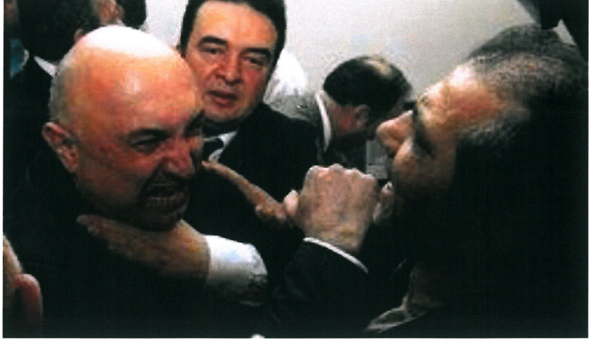
Resim 15. www.hurriyet.com , “İsimsiz”