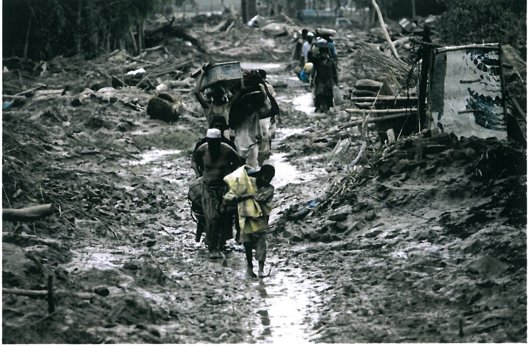
Resim 5. Mohammad Sajjad, “İsimsiz”