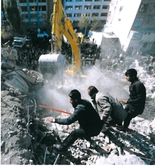
Resim 11. "İsimsiz"