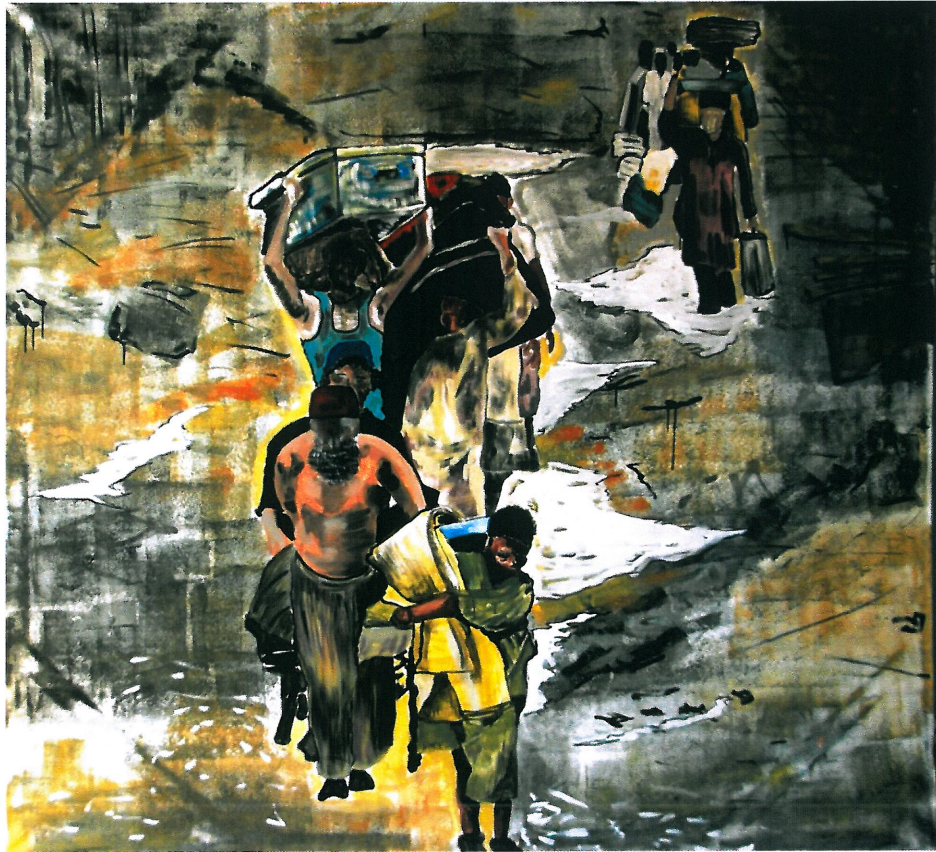
Resim 6. Koray Mercan, “Selden Kaçış”, t.ü.y.b.