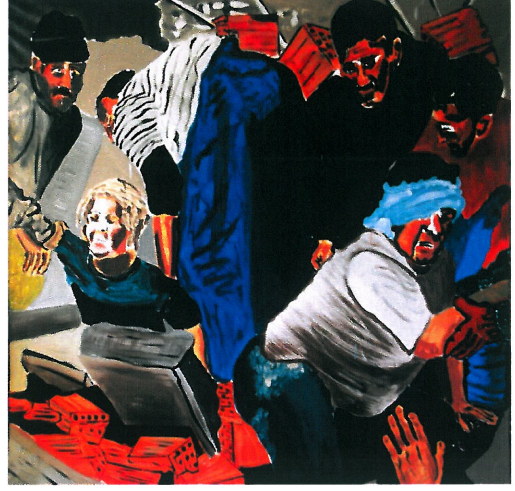
Resim 8. "Enkaz"

Gazete görseli olan Resim 7 , Resim 8 'de "Enkaz" adı ile resme dönüştürülmüştür. Çalışmada, altı tane figür yer almaktadır. Ön planda enkaz altından kurtarılmaya çalışılan iki depremzede görülmektedir. Kurtarılan insanların yüzlerinde acı, korku gibi ifadeler göze çarpmaktadır. Depremzedeleri kurtarmaya çalışan insanların yüzlerinde ise hem insanları kurtarmannın sevinci hem de depremin üzüntüsü görülmektedir. Resim 7 'deki cansız renklerin tersine, daha parlak ve çarpıcı renkler kullanılıp, resimde kütle ve hacim ön plana çıkarılmıştır. Katı, keskin formların insan üzerindeki tedirgin edici ve gerilim arttırıcı özelliğinden yararlanılarak tuğlalar ve bina kalıntıları resmin ön kısmına dağıtılmıştır. Bu da yaşanan kargaşaya duygusal bir gönderme niteliği taşımaktadır.