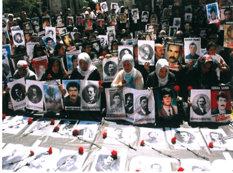
Resim 17. www.baskahaber.org , “İsimsiz”