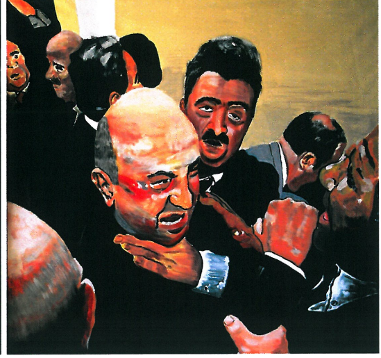
Resim 16. "Kavga"

Resim 15'teki gazete görselinden yola çıkılarak yapılan Resim 16'daki çalışmada, dokuz tane figür bulunmaktadır. Figürler dağınık bir şekilde kurgulanmıştır. Kompozisyonda iki ana plan vardır. Bunlar, figürlerin toplu biçimde bulunduğu resmin sağ kısmı ve resmin solunda son figürün bulunduğu arka plandır. Resimde koyu değerlerin egemenliğinin yanı sıra kompozisyonun sağında bulunan duvar aydınlık, son figürün yer aldığı arka plan karanlık olarak tuvale aktarılmıştır. Figürlerin konumu ve duvarlardaki aydınlık- karanlık etkisi resme derinlik katmaktadır.