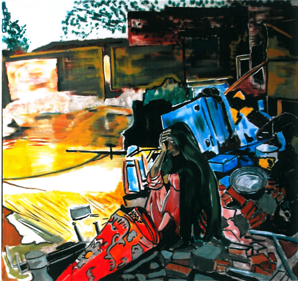
Resim 2. Koray Mercan, “Çaresizlik”, t.ü.y.b.