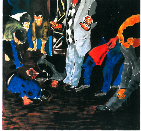
Resim 12. "Arayış"

Resim 11 'deki gazete görselinden yola çıkılarak yapılan Resim 12 'deki çalışmaya koyu renkler egemendir. Resimde "v" şeklinde sıralanmış figürler görülmektedir. Kompozisyonda hareket enkazın olduğu yerde daha yoğundur. İnsanların ifadeleri donuk bir şekilde resmedilmiştir. İnsanların içinde buldukları kaosu göz önüne alarak, resimde figür ve mekana koyu grilerle belirsiz bir anlatım yaratılmıştır.