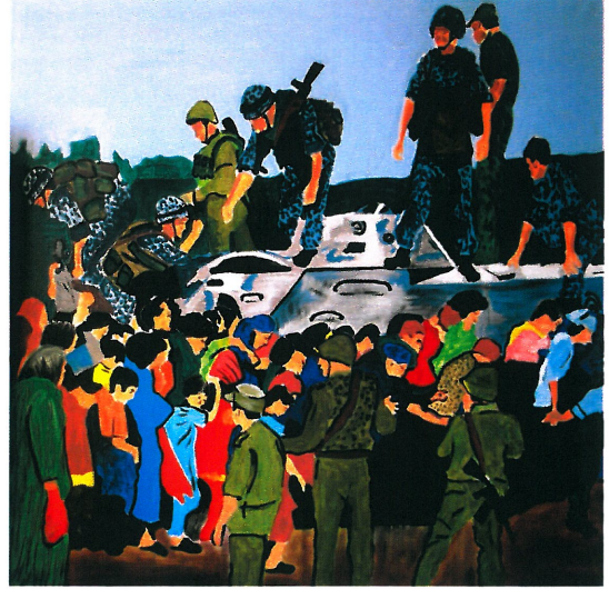
Resim 20. "Mülteciler"