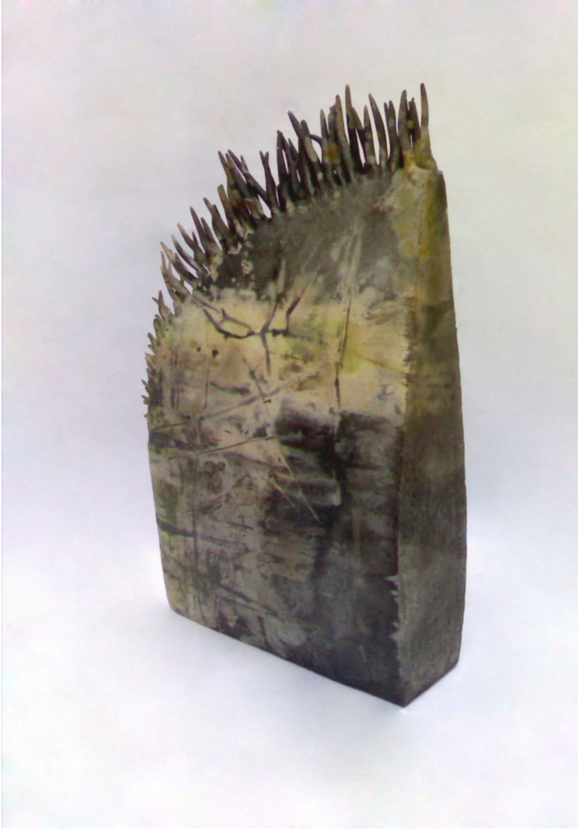
Resim 4 "Long Qua" "Bahar Ejderhası"