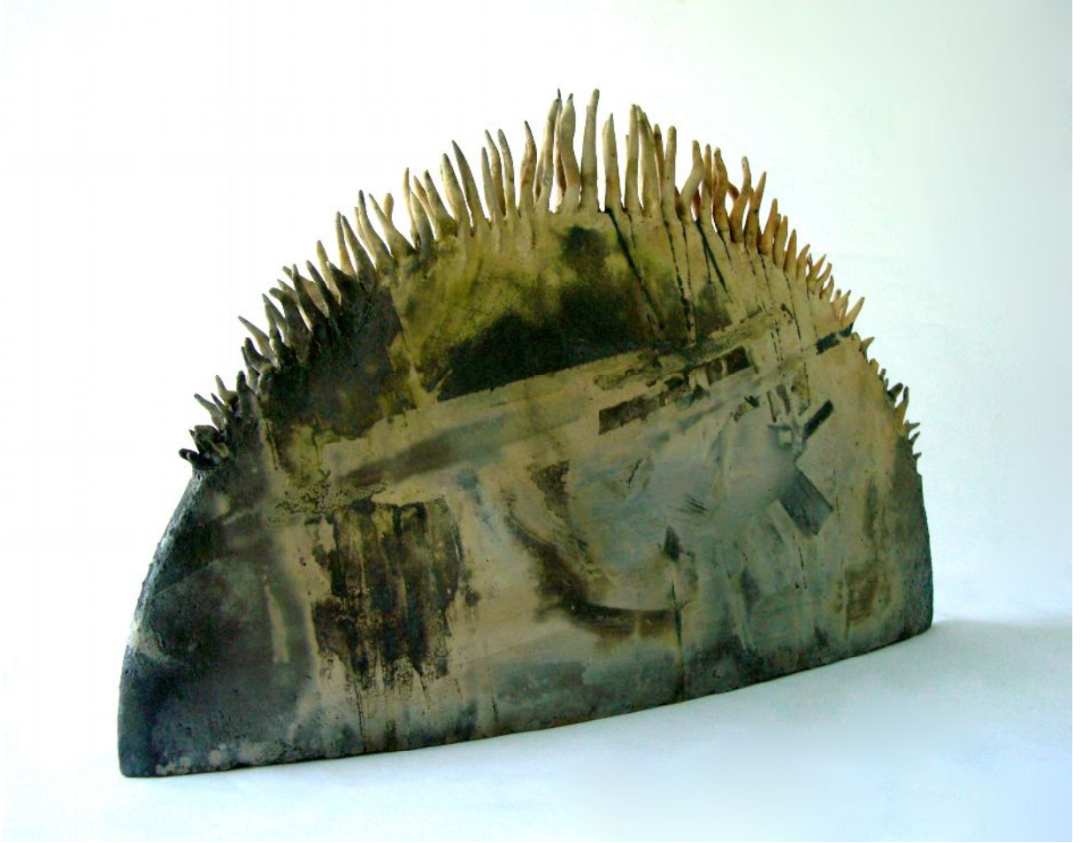
Resim 2 "Long-Sun" "Güneş Ejderhası"