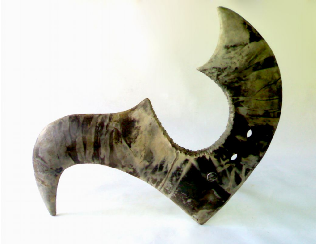
Resim 11 "Long-Wang" "Ejder Kral"