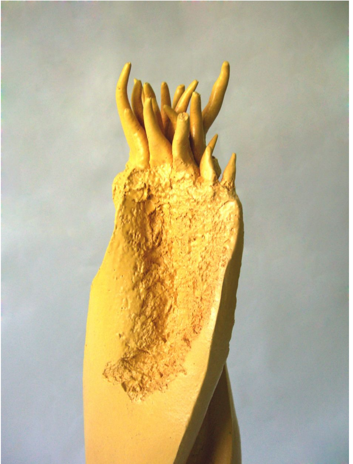
Resim 14 "G-Long" Detay