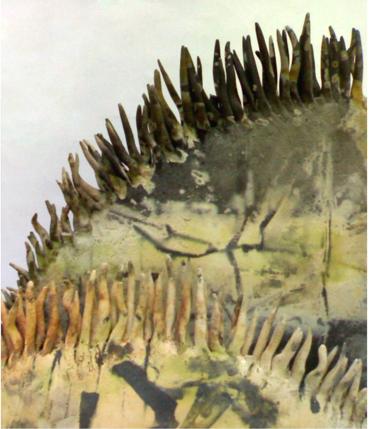
Resim 6 "Kompozisyon" Detay