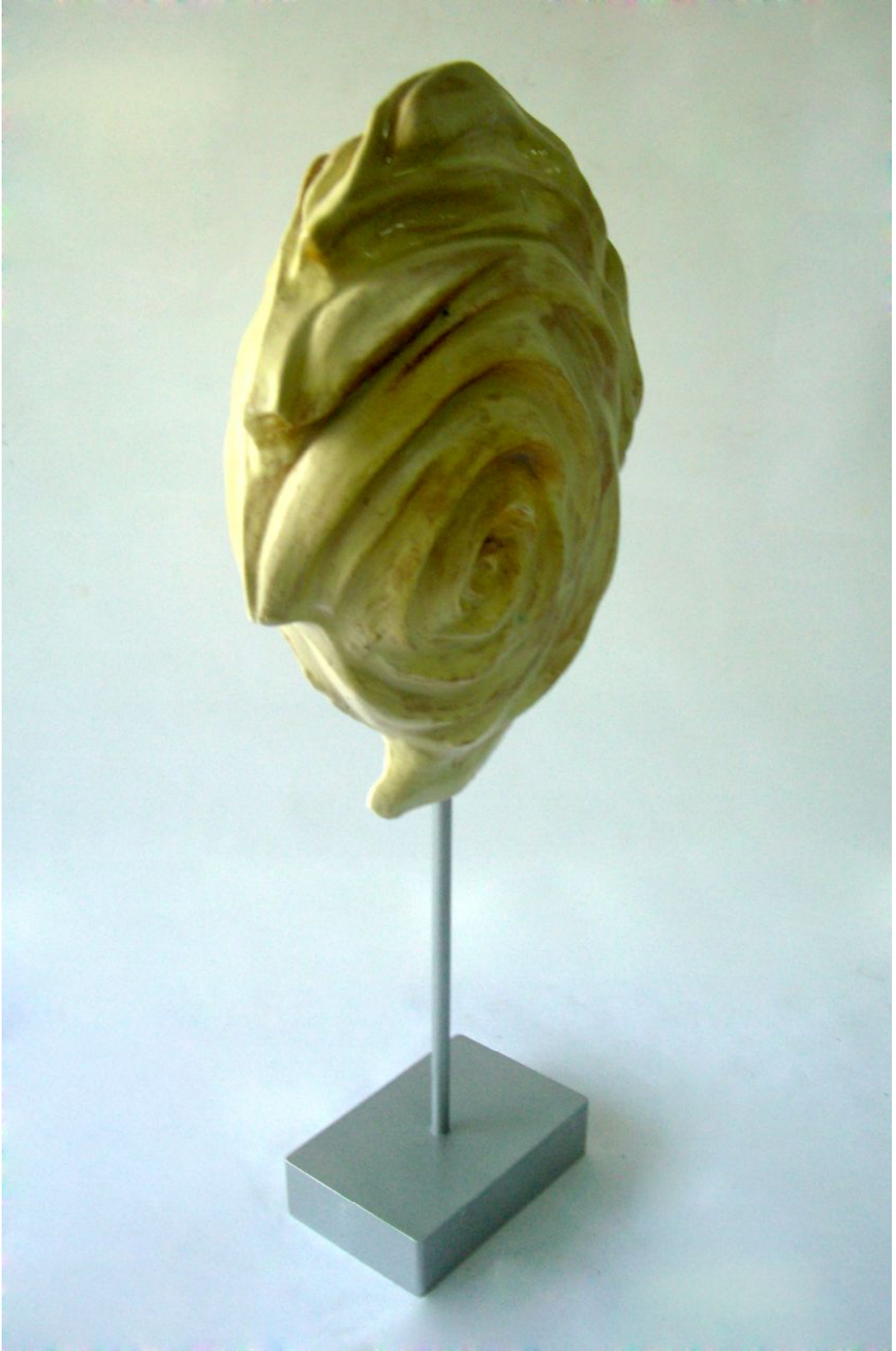
Resim 8 "Di-Long" "Suların Ejderhası"