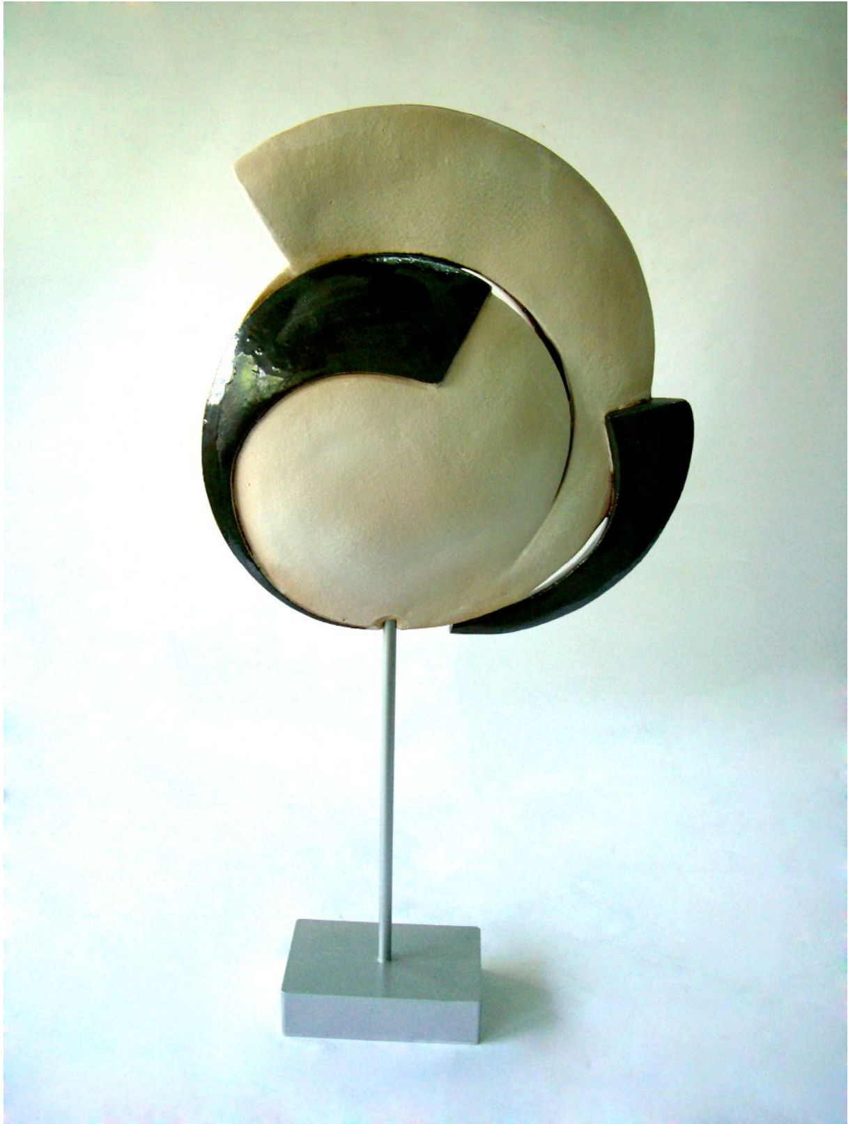
Resim 9 "Ying-Yang-Long"