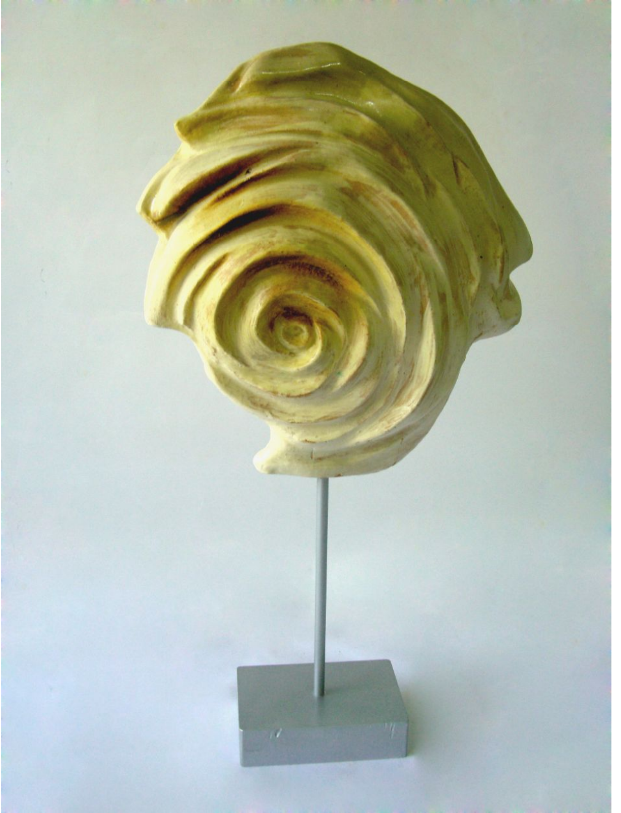
Resim 7 "Di-Long" "Suların Ejderhası"