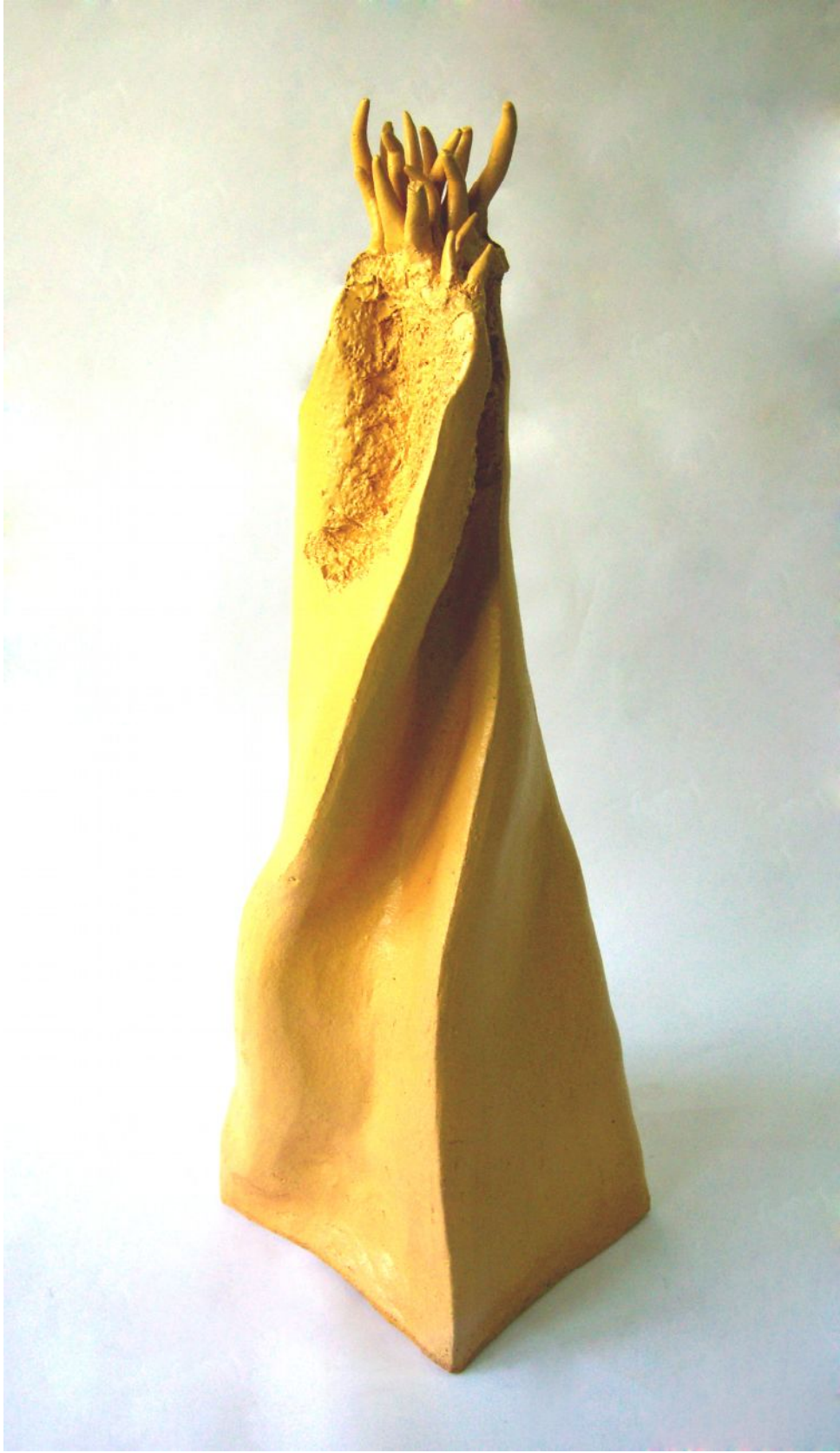
Resim13 "G-Long" "Mitolojik Ejder"