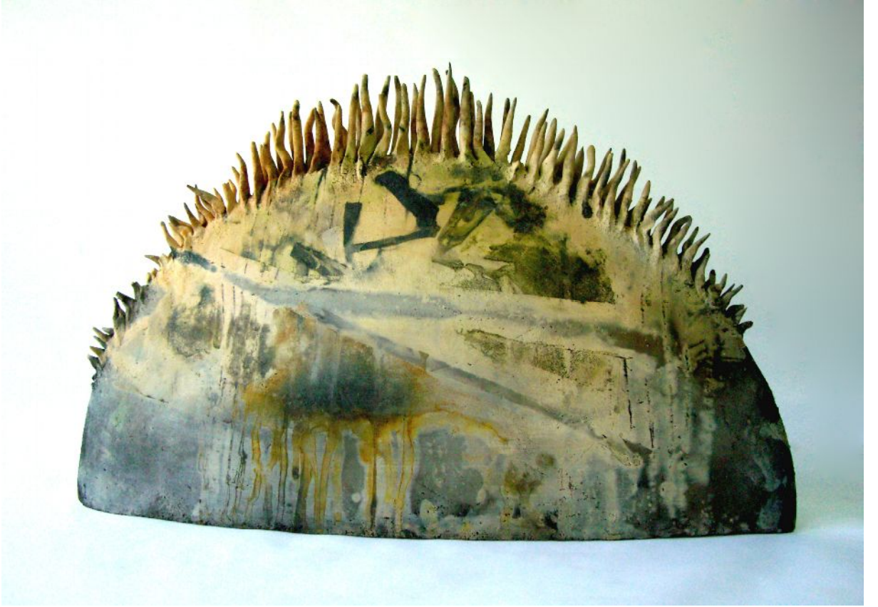
Resim 1 "Long-Sun" "Güneş Ejderhası"