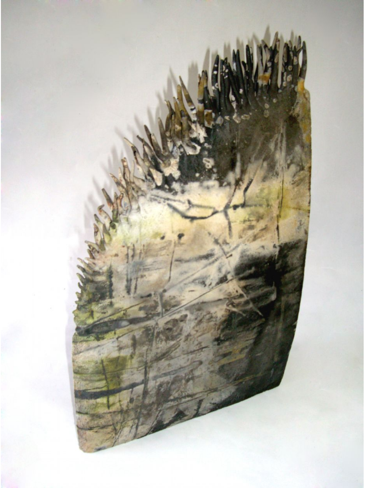
Resim 3 "Long-Qua" "Bahar Ejderhası"