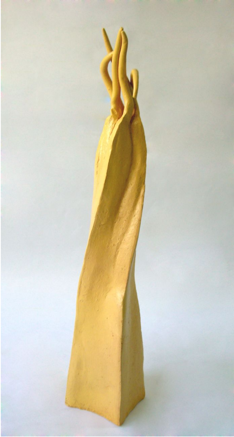
Resim 15 "Shen-Long" "Yağmur Ejderhası"