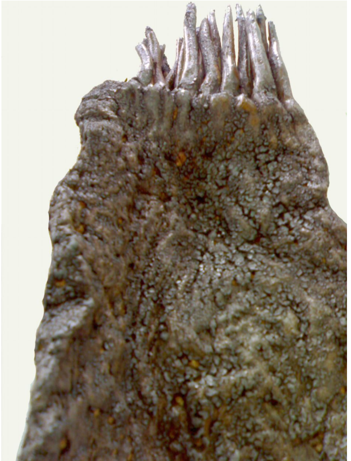
Resim 18 "Tian-Long" Detay