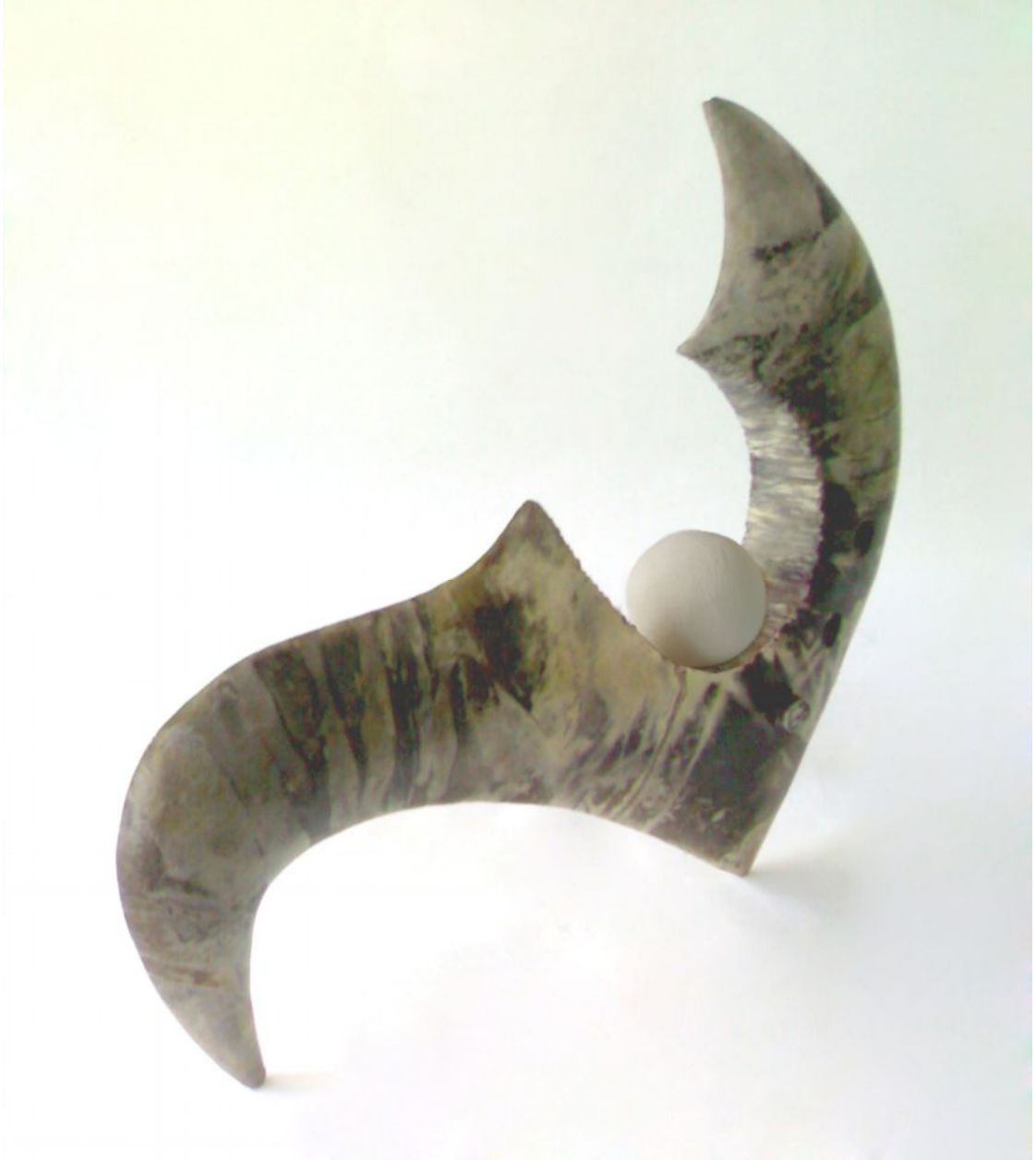
Resim 12 "Long-Wang" "Ejder Kral"