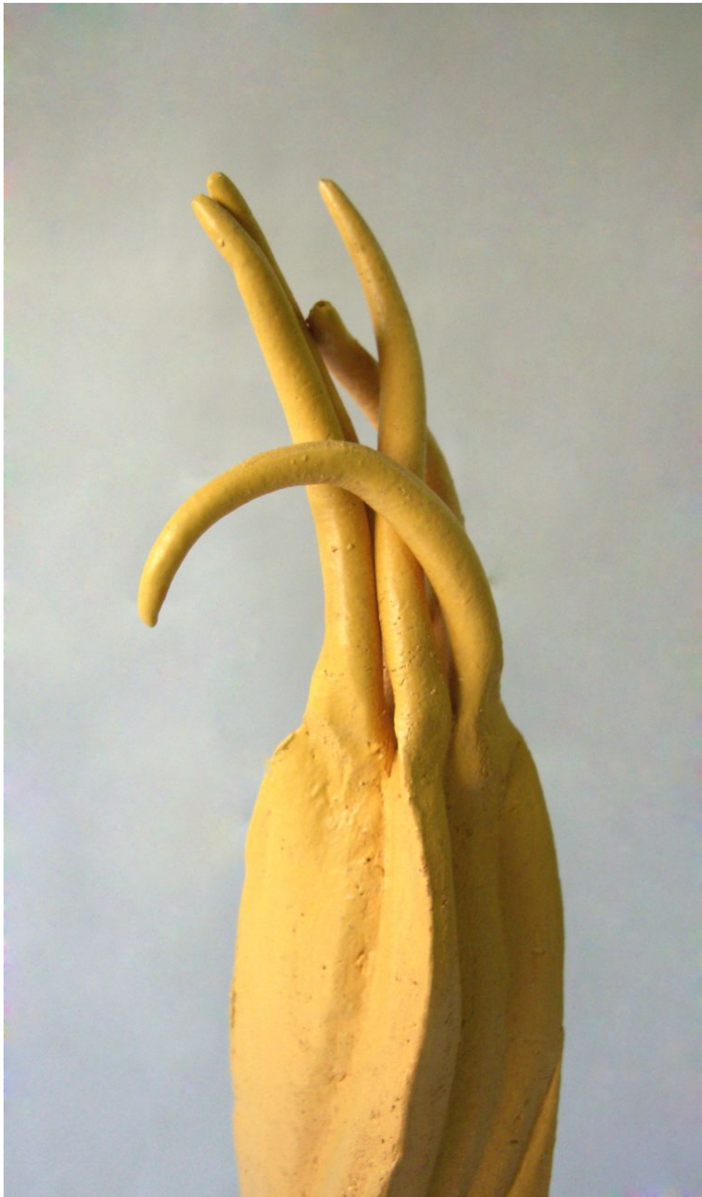
Resim 16 "Shen-Long" Detay