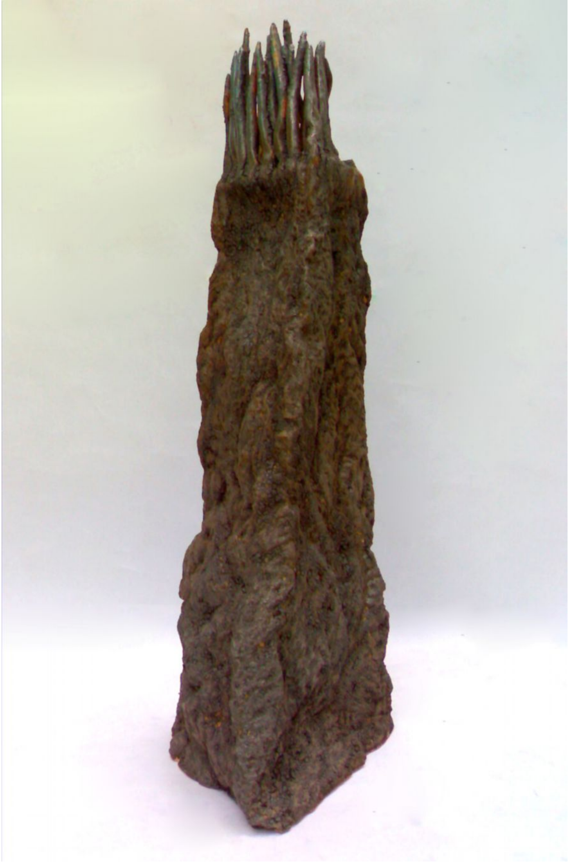
Resim 17 "Tian-Long" "Gökyüzü Ejderhası"