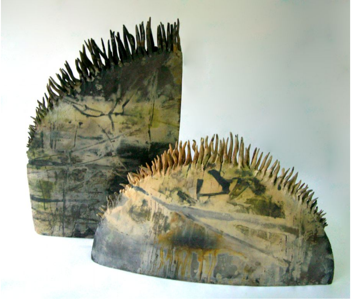
Resim 5 "Kompozisyon"