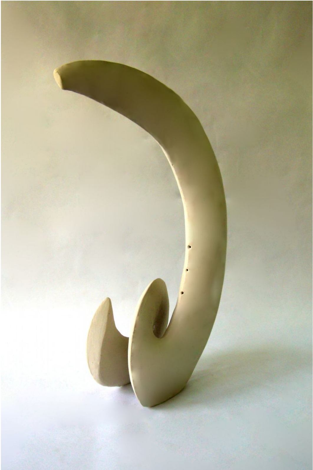
Resim 19 "Ejder"