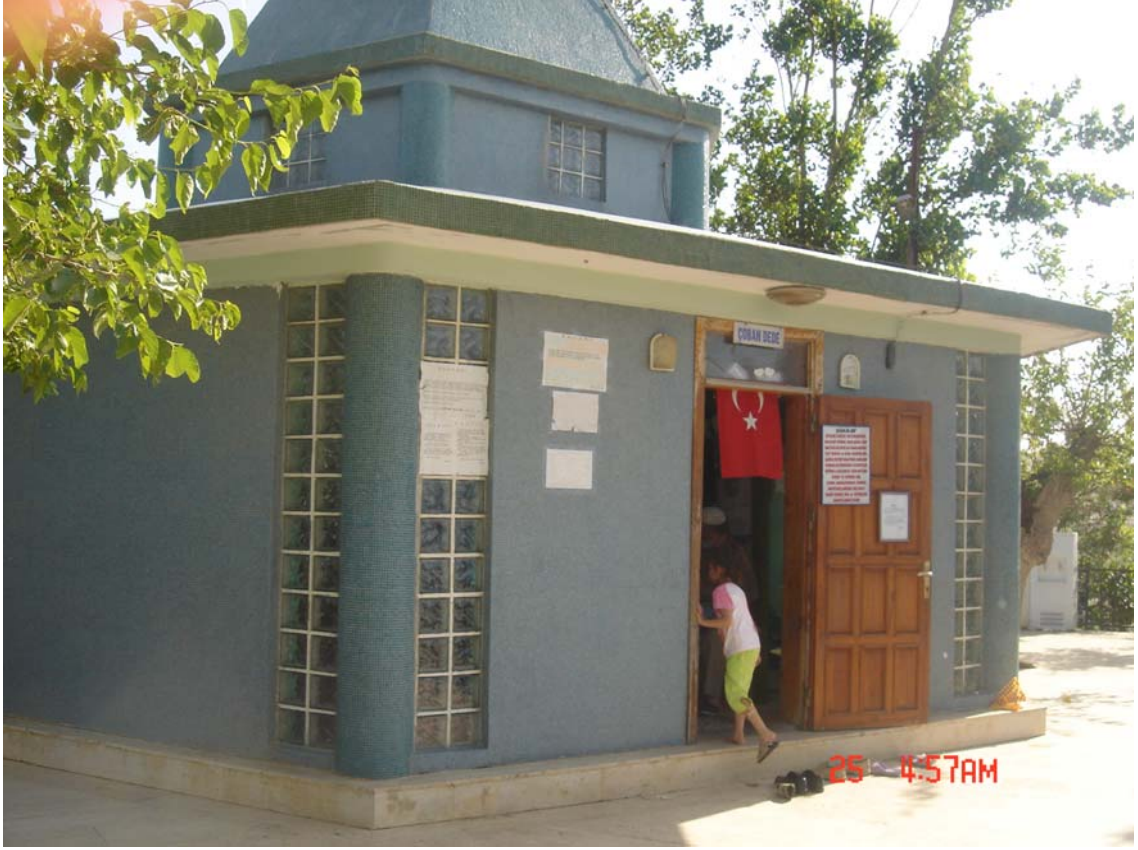
Resim 5:Türbenin Dış Görünüşü

Türbenin içine girdiğimizde; onun üç bölüme ayrıldığını görüyoruz. Kapı girişinin karşısında Çoban Dede'nin sandukası bulunmaktadır. Üzerinde yeşil, Arapça duaların yazılı olduğu bir örtü ve bir bayrak bulunmaktadır. Baş kısmında ise bir çıkıntı ve Çoban Dede'ye ait olduğu söylenen bir sarık vardır. Sağ tarafta içeri giren ziyaretçilerin Kur'an-ı Kerim ve dua okumaları için cüzler, dua kitapları ve bir de rahle bulunmaktadır. Aynı zamanda orada isteyen kişilere kuran okuyan bir bayan vardır. Sol tarafta ise kendisini oranın görevlisi olarak tanıtan ve istenildiğinde ziyaretçiler için dua okuyan, oranın organize işlerine bakan, verilen yardımları alıp fakir insanlara dağıttığı söylenen Deli Yücel lakaplı kişinin odası bulunmaktadır.