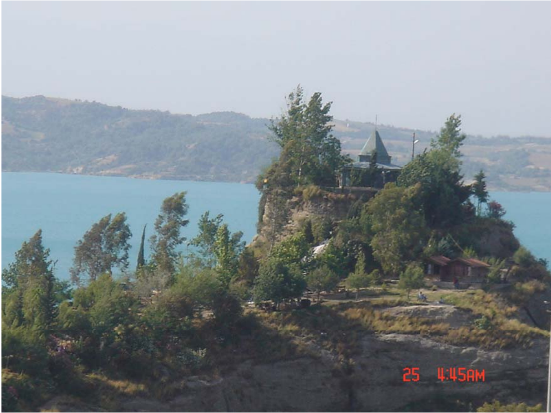
Resim 1: Çoban Dede Türbesi

Çoban Dede Türbesi, bugünkü Adnan Menderes Bulvarı sonunda Seyhan İlçesine bağlı Karşlı Köyü'nde baraj gölü kıyısındaki yüksekçe bir tepe üzerine kurulmuştur. Daha önceleri fazla bilinmeyen bir mezar konumundayken Adana Büyükşehir Belediyesi tarafından yaptırılarak Çoban Dede adında bir türbe oluşturulduğu söylenmektedir. Aynı zamanda kentin bir mesire yeri olan Çoban Dede Türbesi'nin eski halinin nasıl olduğu bilinmemekle birlikte, öncekine nazaran şuan daha temiz ve daha bakımlı bir durumda olduğu söylenmektedir. Belediye tarafından burası halka açık bir yer haline getirilmiş, ziyaretçilerin rahat edebilmesi için birçok imkân sunulmuştur. Ferah ve güzel bir manzaraya sahip olduğu için birçok kişi tarafından tercih edilen bir mekândır.