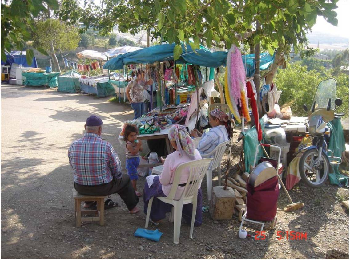
Resim 3: Türbedeki Satıcılar

takılar, tesbihler, çeşitli dini içerikli kaset ve kitaplar, şekerler, örtüler, seccadeler ve buna benzer şeylerdir. Türbeye çıkarken sol tarafta ise, kurban kesim yeri yapılmıştır. Aşağı kesim tamamen mesire yeridir.