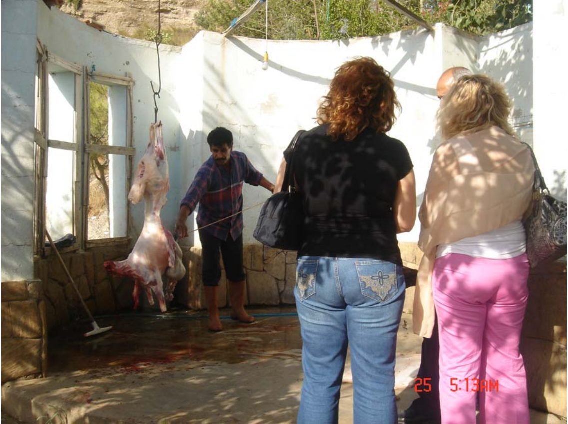
Resim 12: Türbede Adak Kurbanın Kesim Yeri

Çoban Dede Türbesi etrafında adet haline getirilen bu tarz işlemler ve bu bağışların sadece oradaki ilgililerce değerlendirilmesi yatır ziyaretlerinin bir de ekonomik yönünün olduğunu aklımıza getirmektedir. Esasen türbenin etrafında oluşan alış veriş hareketlerine bakıldığında bunu daha net görebiliriz. Ancak bu ekonomik işleyişin hangi kurallara göre nasıl yapıldığı, gelirin nereye gittiği, bu gelir akımının nasıl kanalize edildiği hususunda kesin bilgilere ulaşamadık. Çünkü türbede sorumlu