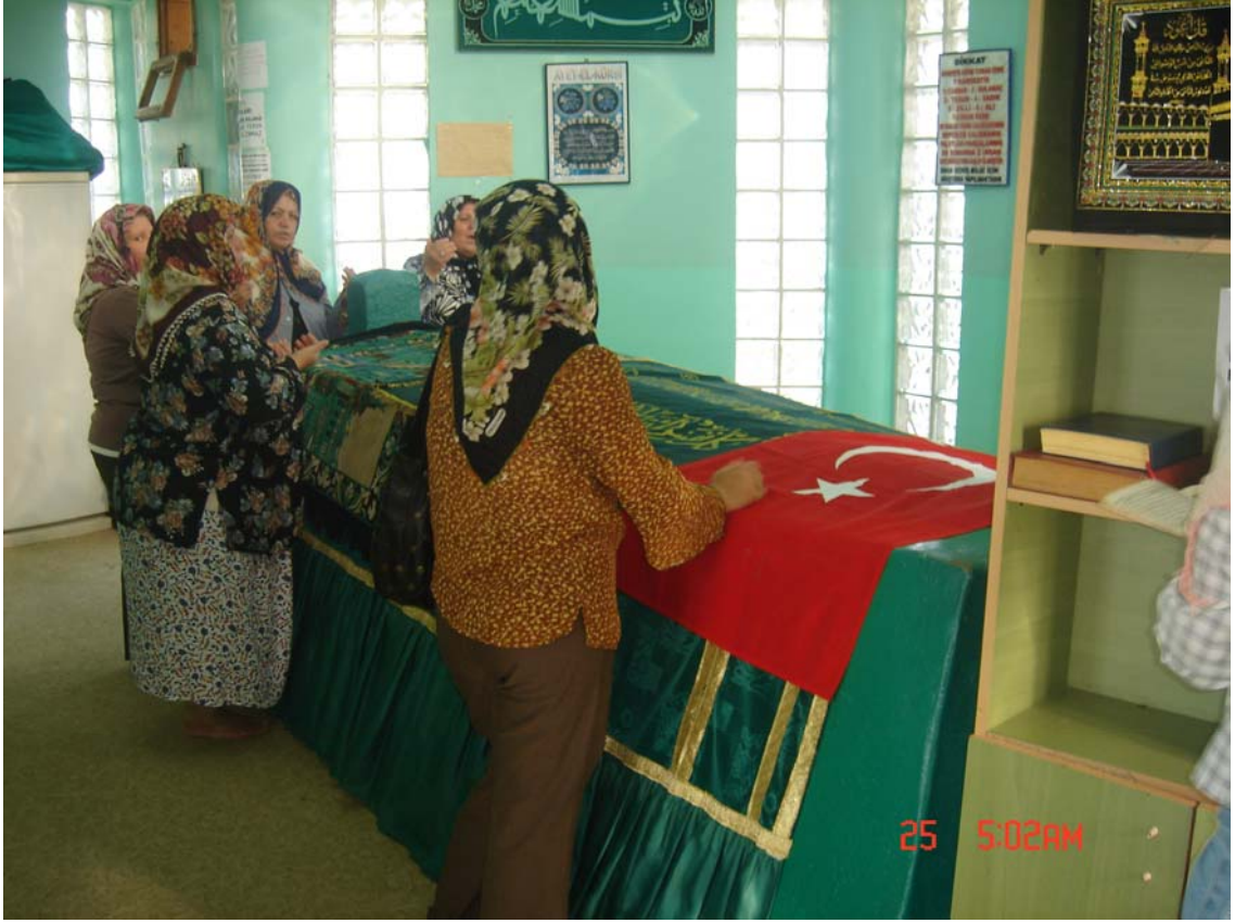
Resim 7: Türbenin İç Görünüşü