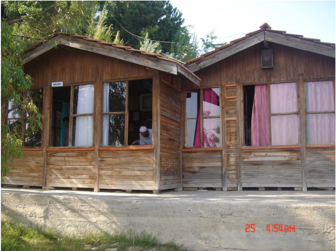
Resim 2 : Türbede Namaz Kılınan Mescit

Türbe yüksekçe bir yamaçta olduğu için dik bir merdivenle oraya çıkılmaktadır. Türbenin biraz aşağısında abdesthane, erkek ve kadınların namaz kılabilmesi için iki mescit vardır.