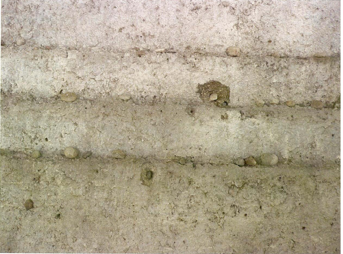
Resim 10: Duvara Yerleştirilmiş Küçük Taşlar