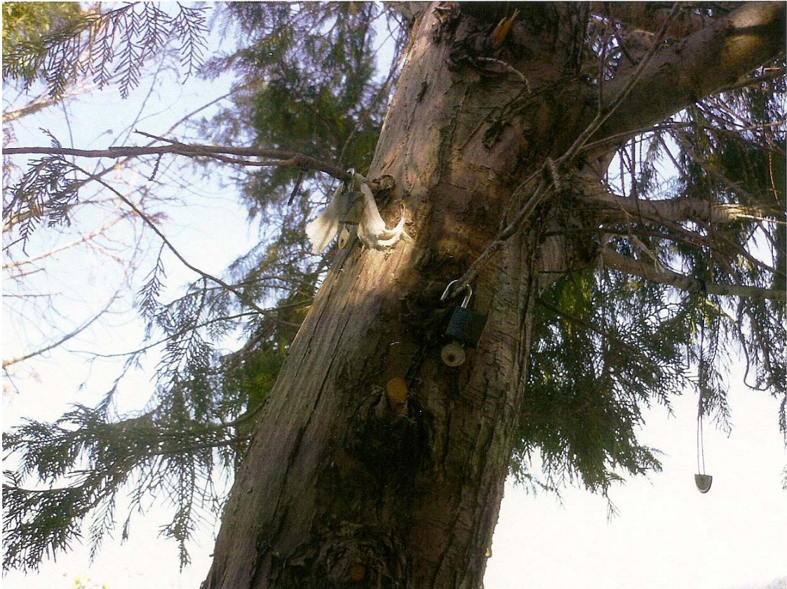
Resim 9: Çoban Dede Türbesinde Kısmet Açtırmak için Ağaca Asılan Açılmış Kilit

Çoban Dede Türbesi’nde de bu işlemler görülmektedir. Kilit açık bir şekilde oradaki ağacın üzerine asılmaktadır.