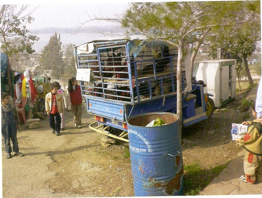
Resim 11: Adak Hayvanlarının Satış Yeri

Genellikle adak kurbanları oraya kestirilip, kestirdikten sonra görevliye teslim edilip, fakirlere dağıtılması istenilmektedir. Bizzat edindiğim gözleme göre ortalama 50 yaşlarında bir bayan türbede gerekli işlemlerini yapıp duasını ettikten sonra, görevliye adak adamak istediğini söylüyor. Sonra görevli o bayanı aşağıda tavuk, horoz gibi hayvanların satışını yapan şahsa yönlendirerek hayvanı satın alıp adakların kesildiği yere gitmesini söylüyor. Böylece adak adama işlemi gerçekleştirilmiş oluyor.