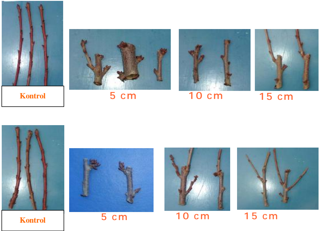
Şekil 4.2 0900 Ziraat, Summit Kiraz Çeşitlerinde Yapılan Farklı Budama Uzunlukları ve Kontrol

Denemede yer alan şekil 4.2 ve 4.3’ de gösterilen farklı kesim uzunluklarına sahip 0900 Ziraat, Sweetheart, Lapins, Summit kiraz çeşitlerinde 1 ve 2 yıllık dallardan alınan