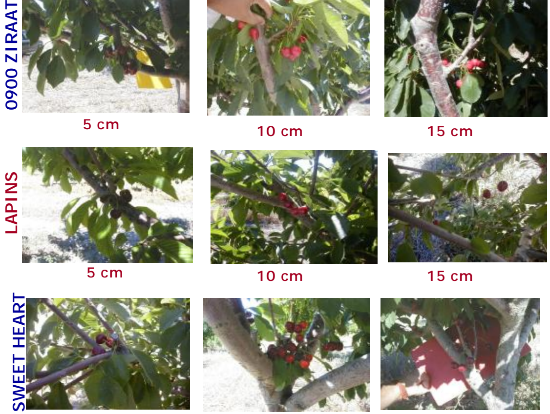
Şekil 4.4 Denemede Yer Alan 0900 Ziraat, Lapins, Sweetheart Kiraz çeşitlerinin Farklı Uzunlukta Yapılan Kesimler Sonucunda Oluşan Meyve Tutumlarından Bir Görünüm