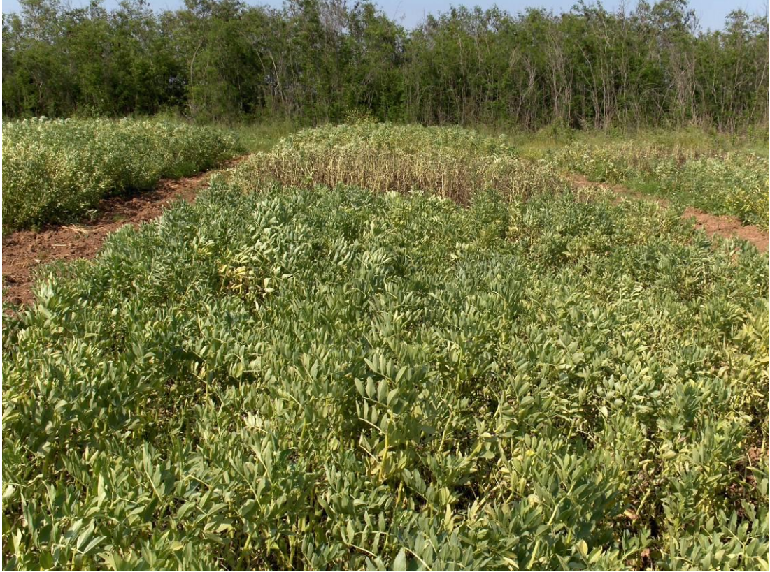
Resim 3.1. Deneme alanından genel görünüm.

Çukurova Üniversitesi Ziraat Fakültesi Tarla Bitkileri Bölümü Araştırma Deneme Alanında, 2005 – 2006 yetiştirme sezonunda yapılmış olan bu çalışmada, Ege Tarımsal Araştırma Enstitüsünden sağlanan Eresen – 87 ve May Tohumculuk firmasına ait bölgede ekimi yapılan Lara ve Seher bakla ( Vicia faba L.) çeşitleri materyal olarak kullanılmıştır.