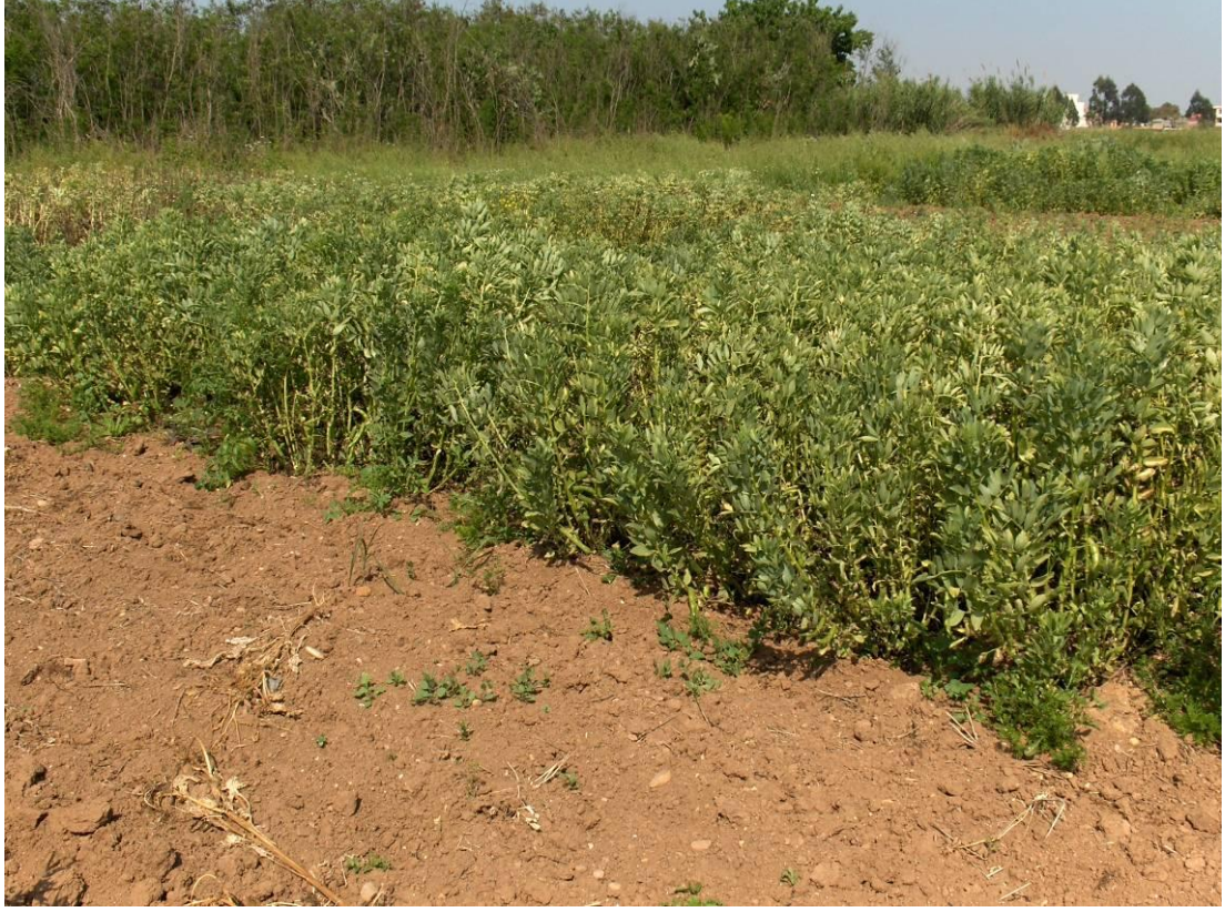
Resim 3.2. Deneme parsellerinden genel görünüm.