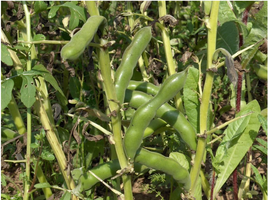
Resim 3.4. Bakla Tanelerinden genel görünüm.

Değerlendirmeler, MSTATC istatistik paket programı kullanılarak bölünmüş parseller deneme desenine göre bilgisayarda yapılmıştır. Önemli çıkan etkileşimlere ait ortalama değerler arasındaki karşılaştırmalar Duncan (%5) ve çeşit ve ekim sıklıkları ortalama değerleri arasındaki karşılaştırmalar LSD (%5) testine göre yapılarak gruplandırılmıştır.