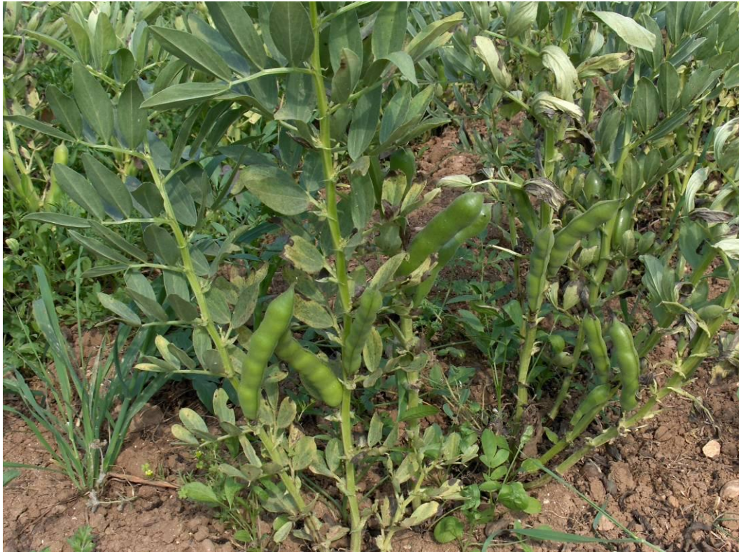
Resim 3.3. 15cm sıra üzeri aralıkla ekimi yapılan parselden görünüm.

Araştırma Çukurova Üniversitesi Ziraat Fakültesi Tarla Bitkileri Bölümünün taban araziyi temsil eden Araştırma Deneme Alanında, 2005 yılı Kasım ayında, bölünmüş parseller deneme desenine göre üç tekrarlamalı olarak kurulmuştur. Araştırmada, bakla çeşitleri ana parselleri, sıra üzeri mesafesi (5, 10, 15 cm) ise alt parselleri oluşturmuştur. Ekimler her parsel 5'er sıra olmak üzere, sıra arası 60 cm, 5 m uzunluğundaki sıralara olacak şekilde yapılmıştır. Parsel boyutları 5m x 2.4 m = 12.0 m 2 olarak belirlenmiştir. Ekimden önce 2 kg/da N, 4 kg/da P 2 O 5 gelecek şekilde taban gübrelenmesi yapılmıştır.