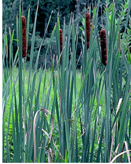
Şekil 1.2 Typha Latifolia Yapay Sulak Alan Bitkisi Örneği (www.apms.org)

kullanılan yapay sulak alan sistem çıkışında 30 mg/l BOİ 5 , 6 mg/l TKM ve 18 mg/l NH 3 değerlerine ulaşıldığı görülmüştür (U.S.EPA, 1993).